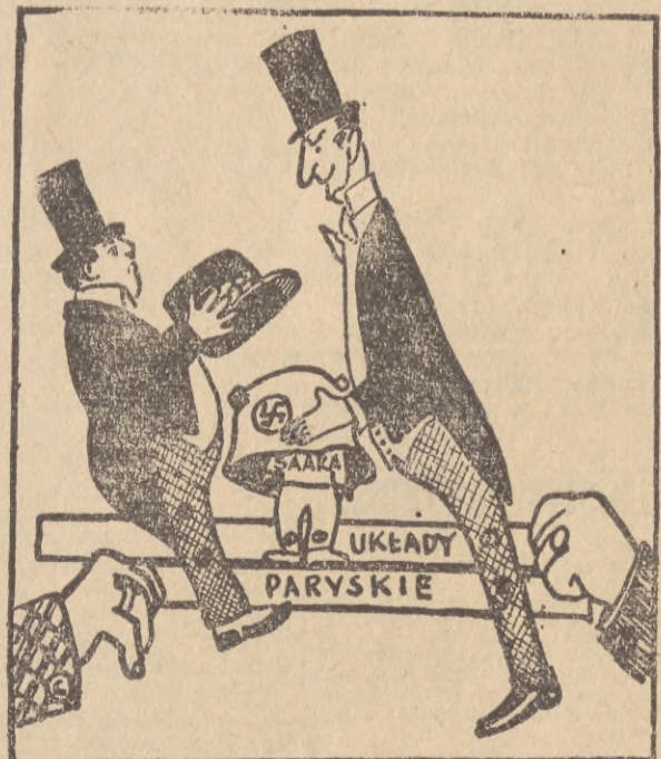
Każdy z nich chciałby zagarnąć Saare pod swój kapelusz. Ale śmiejący się trzeci partner w grze pozostaje w ukryciu. (Krokodyl)