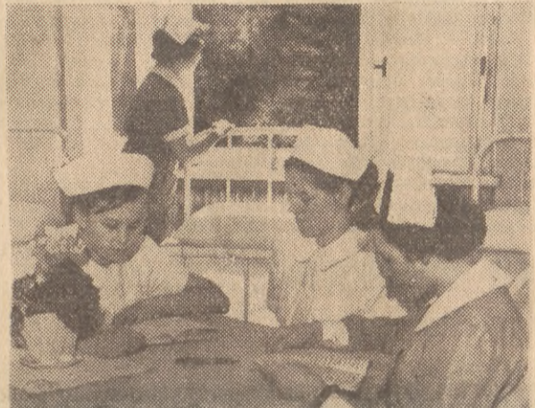
Ale w takich warunkach, jakie zapewnia szkoła, naprawdę można się oddać nauce bez reszty. O nie nie trzeba się martwić. No, bo i o co, jeśli się ma bezpłatne mieszkanie w czystym, wygodnym i wyposażonym nawet w pościel pokoju internatowym, zapewnioną opiekę lekarską, możliwość korzystania ze szkolnych podziemi, pewność otrzymania stypendium odzieżowego (od 200 do 800 zł, gdy trzeba koniecznie dokupić coś z garderoby, doskonale wyżywienie w sypialni na całą akademię ze swego poziomu kulinarnego stołówce...

Zewnętrzna oznaka posiada nego dyplomu jest szeroki czarny pasek na czepku. Dyplomowana położna ma pasek czerwony. Ale na szeroki pasek trzeba zapracować. Dwa lata wytężonej nauki dają dopiero tę satysfakcję. Dwa lata ścieżenia nad książką w gładkim białym czepku i szarym mundurku, dwa lata patrzenia na ręce instruktorek i wprawiania własnych rąk do sprawnego wykonania trudnych czasami i odpowiedzialnych zabiegów.