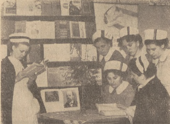
Nauka — nauka, ale zawsze i lepsze się ma samopoczucie, jeśli można spędzić wolne chwile na przyjemnym rozrywce. I o tym pamięta kierownictwo szkoły. KSIĄŻKI, KING, TEATR, WYCIECZKI... A także SPORT (dziewczeta grają doskonale w siatkówkę, zajęły trzecie miejsce w eliminacjach międzyszkolnych), a także ŚWIETLICA. A propos świetlicy — jest ona w gdańskiej szkole pielęgniarek naprawdę przyjemna, taka jakaś „domowa”, przytulna.