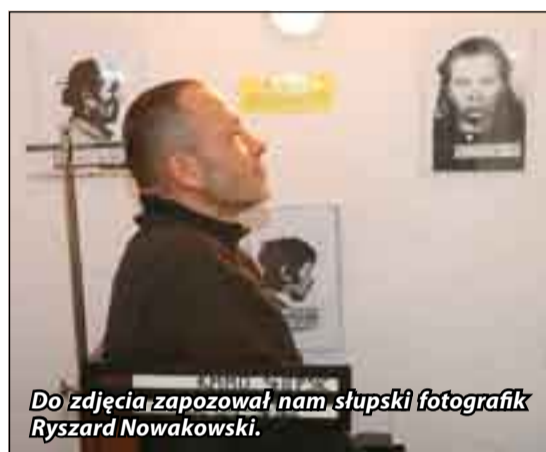
Do zdjęcia zapozował nam słupski fotografik Ryszard Nowakowski.

cjonariuszy i urzędzeniami do badania linii papilarnych, sporządzenia portretów pamięciowych w warunkach, w których byli milicjanci łamiący regula-