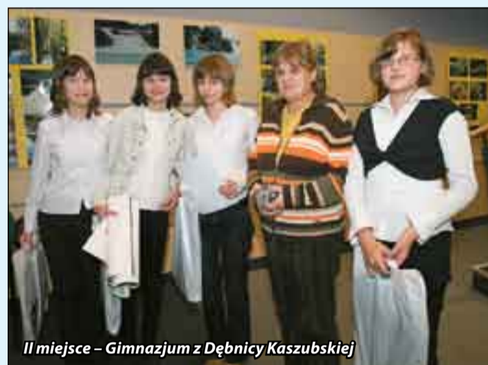
II miejsce – Gimnazjum z Dębicy Kaszubskiej