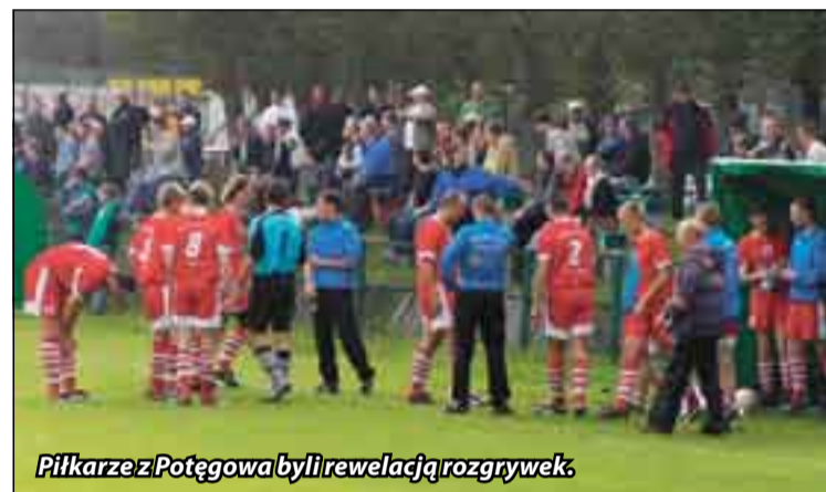
Piłkarze z Potęgowa byli rewelacją rozgrywek.

Zakończyły się rozgrywki rundy jesiennej w Słupskiej Klasie Okręgowej. Mistrzem „jesieni” zostali piłkarze Pomorza Potęgowa z 35 punktami.