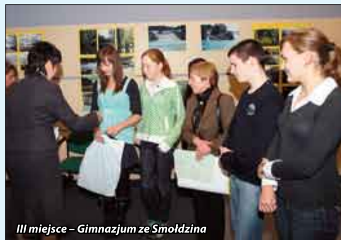
III miejsce – Gimnazjum ze Smołdzina