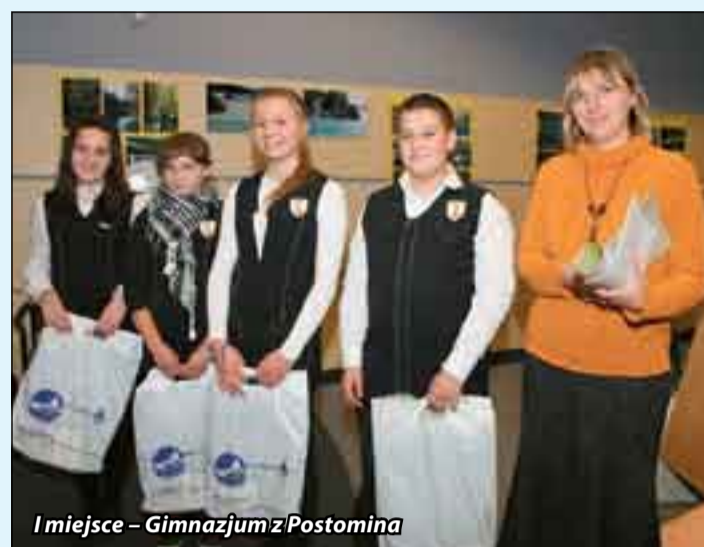
I miejsce – Gimnazjum z Postomina