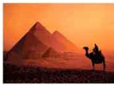
EGIPT - Jedyny pod SŁOŃCEM, wyloty z GDAŃSKA i innych lotnisk przez cały rok