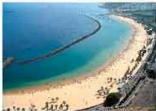
WYSPIY KANARYJSKIE - wyloty z Warszawy, Katowic, Poznania przez cały rok