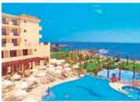
CYPR - samolotem - cały rok