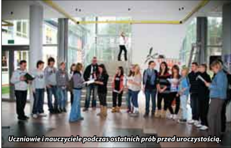
Uczniowie i nauczyciele podczas ostatnich prób przed uroczystością.

Gimnazjum im. Czesława Miłosza w Dębicy Kaszubskiej uroczystość obchodziło 93. rocznicę odzyskania przez Polskę niepodległości. Okolicznościowy program i samo przedsięwzięcie spotkanie przygotowali uczniowie pod opieką swoich pedagogów. Uroczystość była również okazją do złożenia ślubowania przez uczniów pierwszych klas.