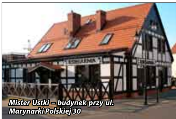
Mister Ustki – budynek przy ul. Marynarki Polskiej 30

Wśród 25 obiektów nominowanych w kategorii „budynki odnowione” zwycięzcami zostali: I miejsce - Mickiewicza 10, II miejsce - Kosynie-