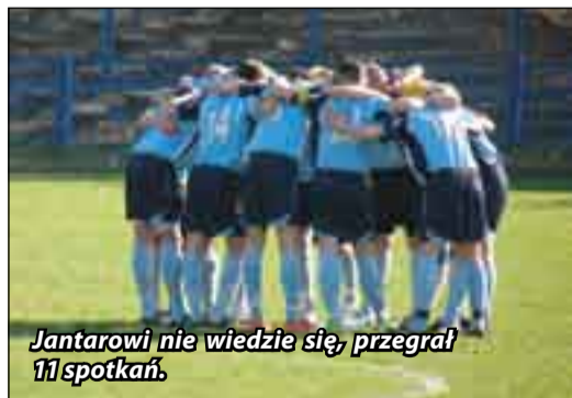
Jantarowi nie wiedzie się, przegrał 11 spotkań.