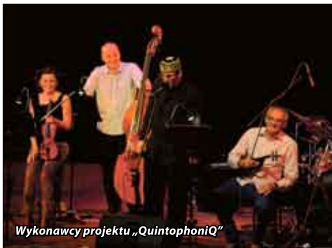
Wykonawcy projektu „QuintophoniQ”