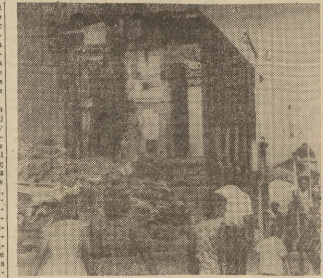
Stolica Macedonii Skopje została zniszczona obrzytnym trzęsieniem ziemi. Oto pierwsze zdjęcie z miejsca katastrofy.

Nieustannym strumieniem napływa też pomoc z zagranicy. Pociągi, samoloty, samochody przywożą materiały opatrunkowe, medykamenty, namioty, łózka polowe, które przekazują organizacje Czerwonego Krzyża i komitety społeczne z wielu krajów.