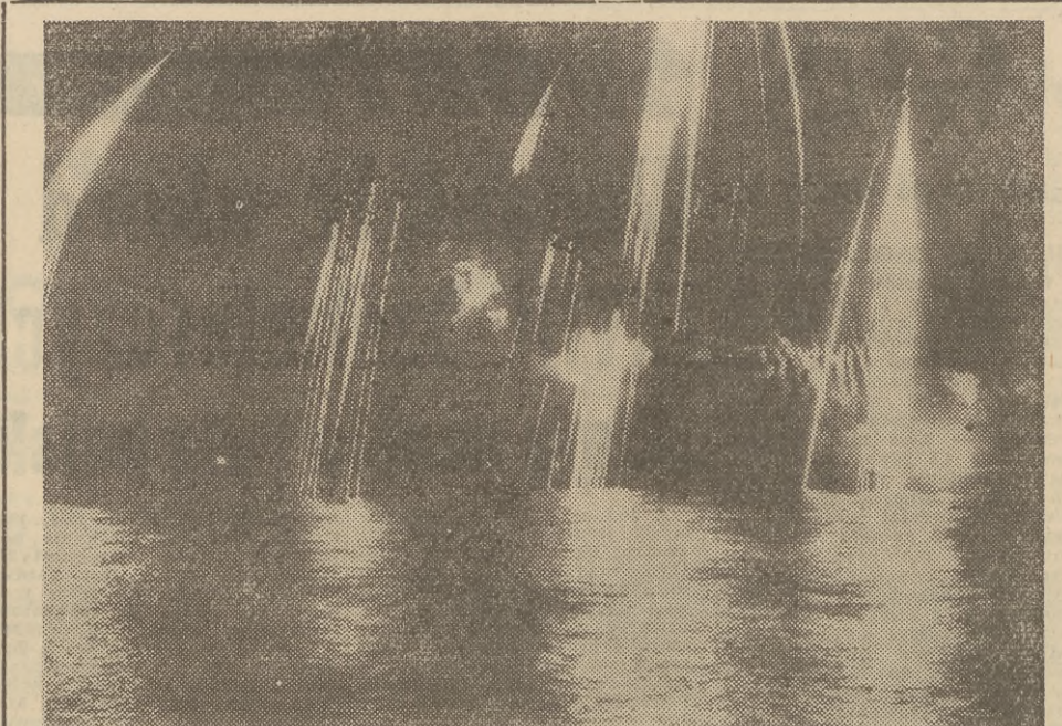
Sztuczne ognie na sopockiej plaży podczas niedzielnej imprezy na molo, który odbył się z okazji zakończenia XXVIII Sierpniowych Mistrzostw Swiata w Gdańsku.