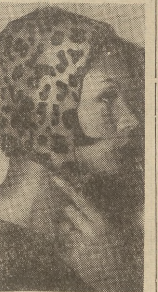
Paryski dom mody Jacques Heim zaprezentował kolekcję kapeluszy na jesień i zimę 1963 — 64 roku. Oto utrzązany kapturek zawiązanym pod szyją.