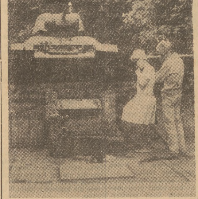
Na Westerplatte przypłyły pamiątkowej pełni straż historycznych — uczestnik zwycięskich walk wyzwoleniych I Brygady pancerniej.

Pierwszy przemawiał i sekretarz KW PZPR w Gdańsku, Jan Płasiński.