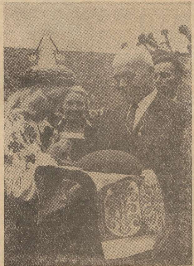
Gospodarz centralnych dożynek i sekretarz KC PZPR Władysław Gomułka z dożynkowymi bochenem chleba

Finał uroczystości — to sztuczne ognie i race, rozrywające się wysoko nad Stadionem Dziesięciolecia. Z góry spływają kolorowe flagi.