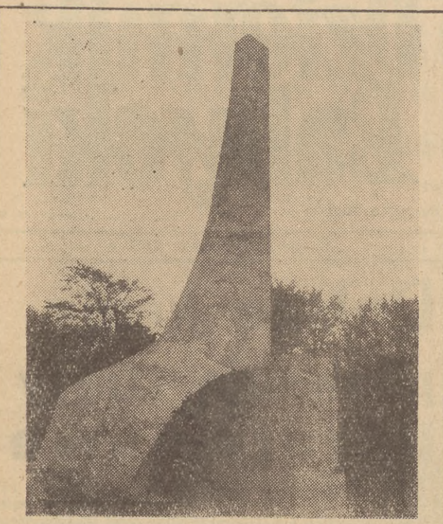
Na zdjęciu: pomnik „Zaślubił Polskę Ludowej z morzem”