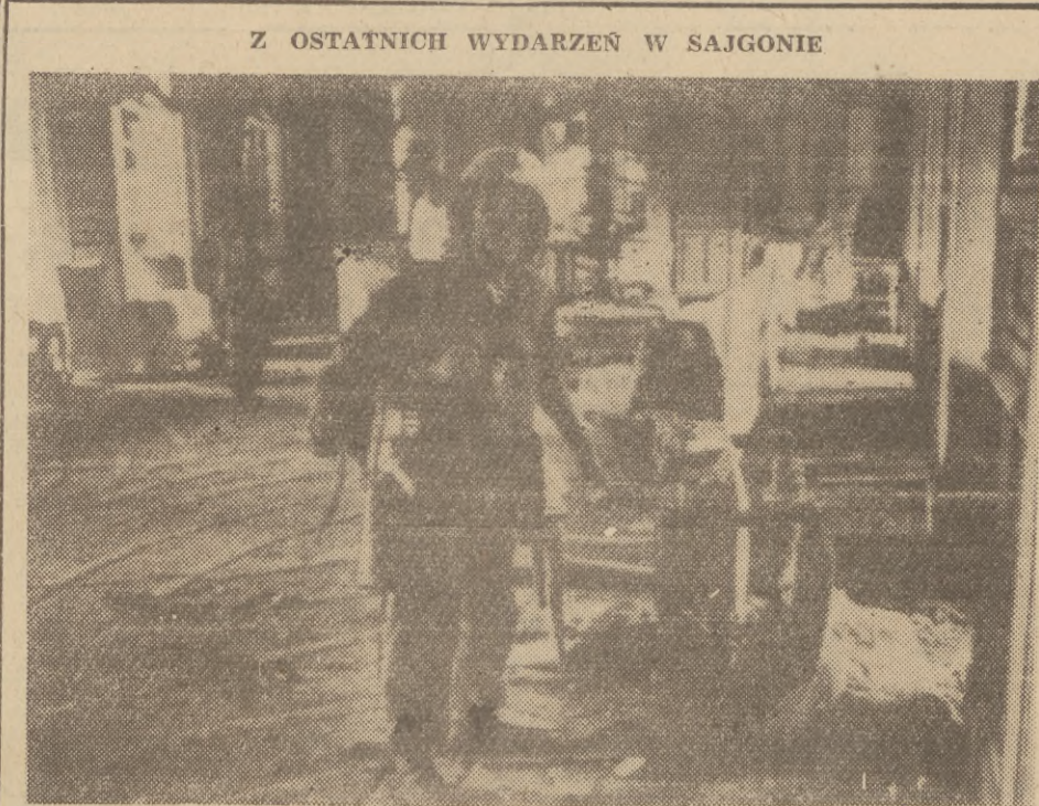
Z OSTATNICH WYDARZEŃ W SAJGONIE

W dawnej sali przyjęć pałacu prezydenckiego. Jeden z żołnierzy, występujących przeciwko Diemowi.