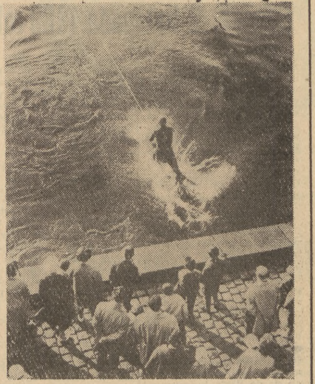
Na zdjęciu niezwykły widok: start do przejażdżki na nartach wodnych po Weltawie.