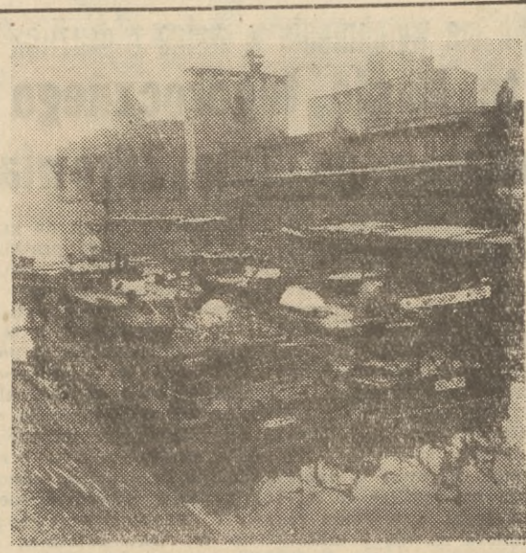
Na Odrze rozpoczął się sezon nawigacyjny. Na zdjęciu: W porcie miejskim we Wrocławiu.

pie zboża. Toteż gdy połów się uda, spieszą do bazy jak na regatach. SCHODZĘ po stopniach do hallu. Wszystko tu łśni i błyszczą jak lustro. — To dzięki kapralskiemu drylowi, jaki u nas panuje — zgaduje moje myśli dyrektor Żalusk.