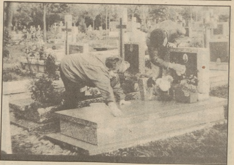
„Człowiek dopóty nie dba o groby, dopóki nie złoży w nich cząstki samego siebie.” Refleksyjna myśl Bolesława Prusa odzywa co roku 1 listopada.

— Bardzo ciepło i serdecznie przez wszystkich, z którymi się spotykał. W Lidzie podczas występu ludzie na widowni płakali i dzie-