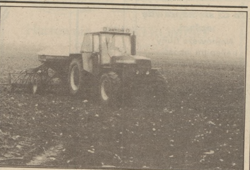
Na polach PGR Tymień trwają siewy zbóż ozimych. Do końca miesiąca zostaną obsiane wszystkie pola. Jest to bardzo dobry PGR.

Z naszego konkursu „200 milionów” są jeszcze trzy nagrody, które nie zostały odebrane. Nagrody należą do naszych Czytelników: Świszyno (bon towarowy 300 tys.), Teresa Woelke zam. Sierakowice, ul. Orzeszkowej 4 i pani Ireny Pydyś zam. w Słupsku, ul. Romera 1/19 (bon towarowy 300 tys.). Osoby te zapraszamy do naszej redakcji, „Głos Słupski”, Słupsk, ul. Jedności Narodowej 4/5 w godz. 9—16. (Jaw)