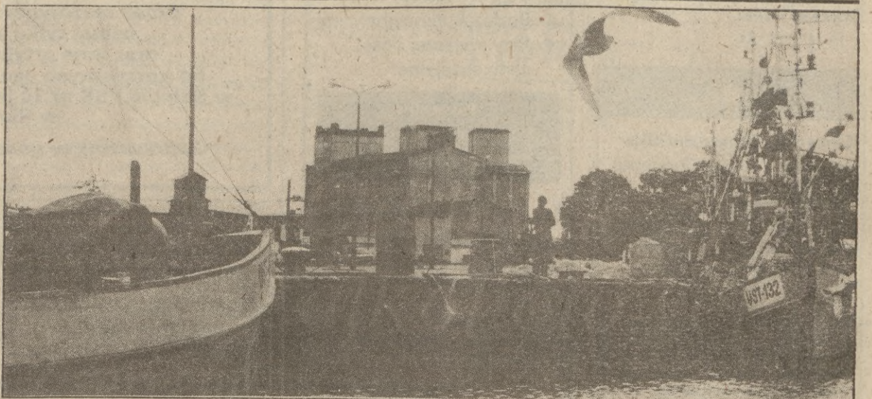
Kutry w porcie, rybacy w domach, czyli normalny dzień w porze jesiennych sztormów na Bałtyku.