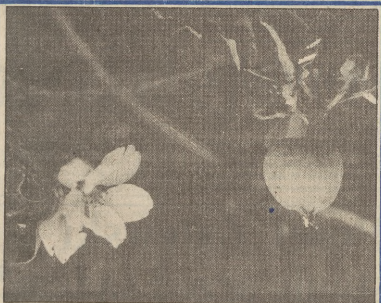
W ogródku przydomowym Wandy Lempke przy ul. Sosnowej w Kolobrzegu zakwitła jabłoń. Na drzewku są zarówno kwiaty jak i owoce.