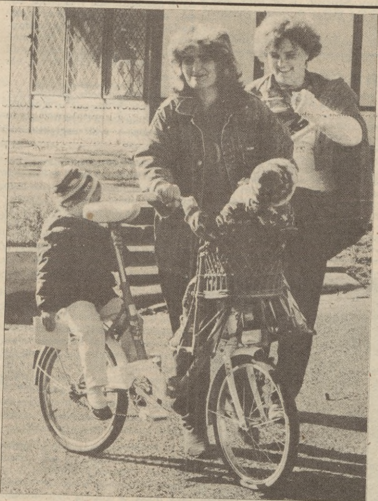
Na wsi, gdzie skupiska ludności są daleko oddalone od centrum handlowego jako środek komunikacji przym wciąg wiedzie rower, ale co zrobić z dziećmi, gdy mama wybrała się po zakupy? Mieszkanca Dębnicy Kaszubskiej znalazła rozwiązanie. Wozí dwójkę ze sobą.

Mam to wszystko za sobą. Nie chcę do tego wracać. Dopóki w grę wchodziła tylko kradzież samochodów, konsekwencje prawne tego czynu nie były zbyt dolegliwe. Teraz w tym interesie mają miejsce sprawy dużo poważniejsze. Znikają ludzie, wydarzają się dziwne rzeczy. Lepiej z tym skończyć, dopóki człowiek nie wdepnął w sytuację bez wyjścia. W Trójmieście zostawiłem połowę domu, samochód, dokumenty, pieniądze. Nie mogę po to wszystko wrócić, bo z pewnością na mnie czekają. Przedostanę się tam, gdzie mam dobre układy, gdzie zniknę byłym kolegom z oczu. (rep) cdn.