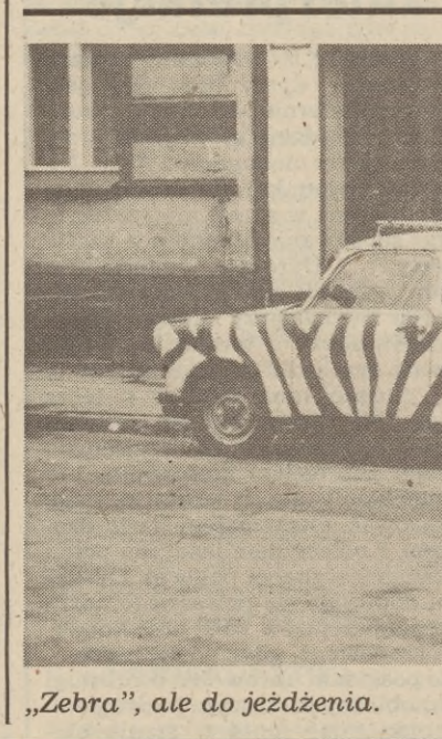
„Zebra”, ale do jeżdżenia.