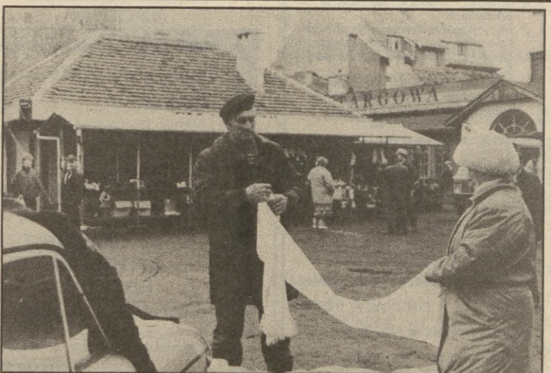
Opodal Bramy Kamiennej w Świdwinie znajduje się hala targowa. Kupcy i drobni handlarze sprzedają towary pod dachem i pod „chmurką”.

niezbylwanego prawa ojcostwa. Akces do organizowanego koła zgłosiło nawet dwu Polaków mieszkających obecnie w Niemczech. Niebawem odbędzie się pierwsze spotkanie grupy inicjatywnej. Informacje tel. 23-153 w Słupsku. (zez)