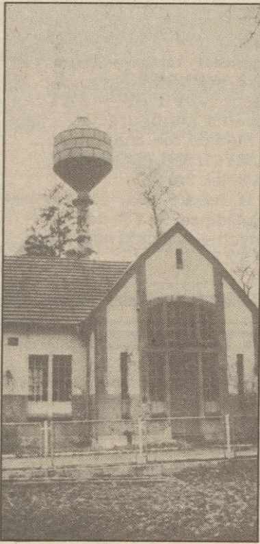
Obok starej wieży ciśnieniowej w Debrznie wybudowano nową. Ma ona 43 metry wysokości i pojemność 500 metrów sześciennych. Pokrywa w pełni zapotrzebowanie miasta na pobór wody. Podobna wieża w Szczecinku uległa zawaleniu. Budowlę w Debrznie zbadali specjaliści i stwierdzili, że nie zagraża jej awaria, nawet podczas największej wichury. Obok wieży znajduje się stara stacja uzdatniania wody, obecnie przygotowywana jest dokumentacja na jej modernizację. Na zdjęciu: Nowa wieża ciśnieniowa. (ho)