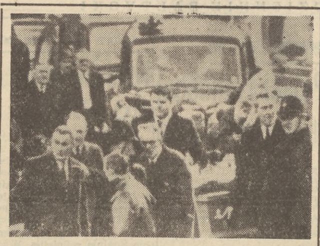
We czwartek 27 bm. odbyły się uroczystości pogrzebowe w Aberfan w Wali, gdzie w ub. piątek ok. 200 dzieci straciło życie w wyniku tragicznej katastrofy.

BONN (PAP). Czterech ministrów zachodnioniemieckich — członków gabinetu Erharda — podało się do dymisji, zakomunikowano w Bonn we czwartek w południe, po posiedzeniu frakcji parlamentarnej FDP, która odrzuciła kompromis w sprawie budżetu na rok 1967, jaki osiągnięto we środę wieczorem na posiedzeniu rządu zachodnioniemieckiego. Natychmiast po zakończeniu frakcji parlamentarnej FDP, przewodniczący partii, Erich Mende i przewodniczący frakcji, von Kuehlmann-Stumm poinformowali kanclerza Erharda i przewodniczącego frakcji parlamentarnej CDU/CSU Barzela, o decyzji FDP wycofania swych ministrów z rządu bońskiego. Mende oświadczył przedstawicielom prasy, że decyzja ta została powzięta przez frakcję parlamentarną FDP jednomyślnie. Kanclerz NRF Ludwig Erhard przyjął dymisję 4 ministrów FDP — dr Ericha Mende (wicekanclerz i minister do spraw ogólnoniemieckich), dr Rolf Dahla (minister finansów), dr Ewald Buehner (minister budownictwa mieszkaniowego) i Waltera Scheela (minister do spraw współpracy gospodarczej). Tym samym nastąpił ostateczny rozłam koalicji rządowej CDU/CSU i FDP. Cztery ministrowie będą pełniły swój urząd do czasu mianowania następców. Jak informuje agencja Reuters, partia socjaldemokratyczna ogłosiła oświadczenie wyrażające zadowolenie z powodu rezygnacji ministrów FDP i wskazujące na gotowość utworzenia koalicji z wolnymi demokratami na warunkach SPD.