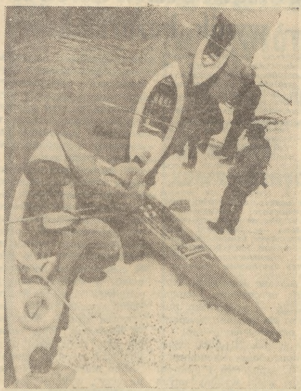
W całym kraju lute mrozy, grypa Hongkong unieruchamia nas w łózkach, a wodniacy wychodzą na wodę. 26 bm. na rzece Wełnie w okolicach Rogoźna (woj. poznański) odbył się zimowy spływ kajakowy. Rzeką podczas największych mrozów nigdy nie zamarała w całości i jej wartki nurt stanowi dużą atrakcję dla wodniaków.