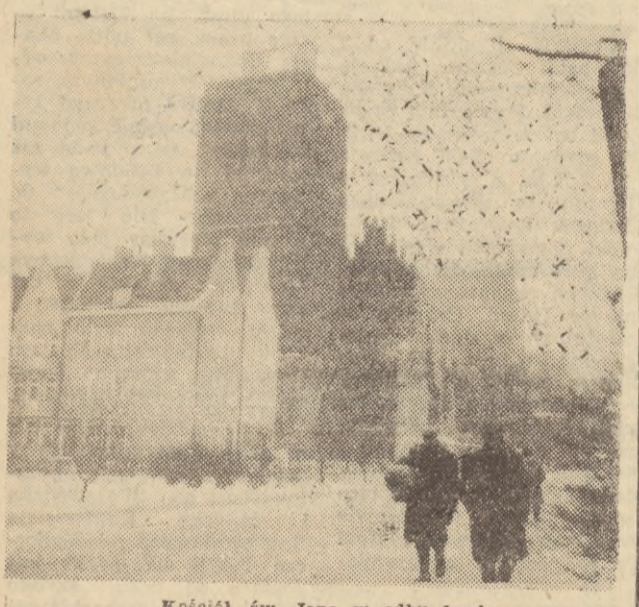
Kościół św. Jana w odbudowie.