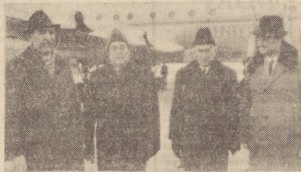
Na zdjęciu: na lotnisku w Moskwie. Od lewej — E. Gierek, L. Breżniew, A. Kosiżyn i P. Jaroszewicz.