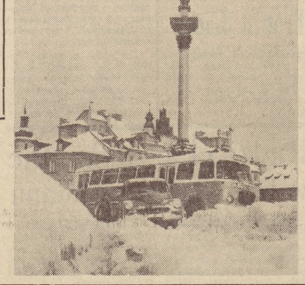
Obfite opady śnieżne, mimo że bywają nieco uciążliwe szczególnie dla osób bezpośrednio zatrudnionych przy likwidowaniu ich skutków, stwarzają nieraz niezwykle malownicze obrazy. Oto zasypany plac Zamkowy w Warszawie, a nad nim — symbol placu — król Zygmunt III.

Dyskusja toczyła się wokół referatów wygłoszonych przez kier. Wydziału Gospodarki Komunalnej i Mieszkaniowej Przew. WRN R. Ławnickiego i prezesa Oddziału Woj. Centralnego Związku Spółdzielni Budownictwa Mieszkaniowego H. Chudacza. Jak wynika z prognoz demograficznych oraz z danych przedstawionych przez spól-