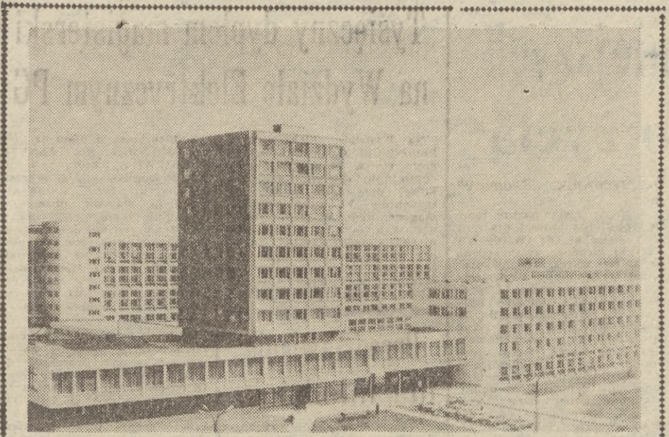
W szóstej pięciolatce bułgarskiej przewiduje się intensywny rozwój elektroniki i techniki obliczeniowej. Na zdjęciu: zakłady urzędów elektronicznych „Electronica” w Sofii.