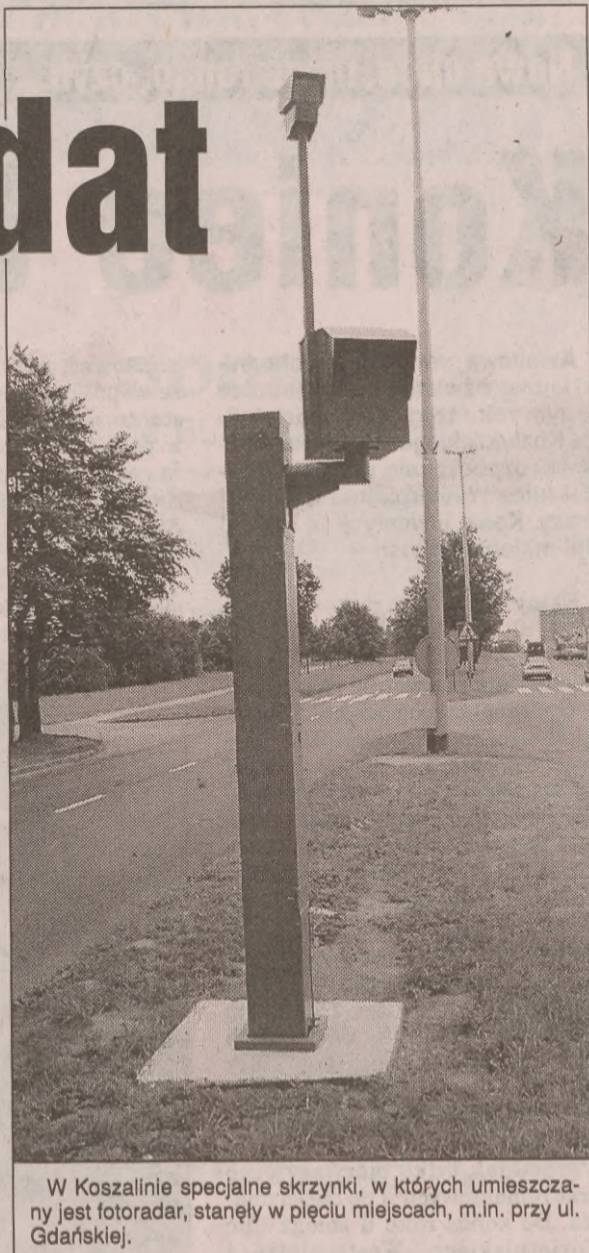
W Koszalinie specjalne skrzynki, w których umieszczony jest fotoradar, stanęły w pięciu miejscach, m.in. przy ul. Gdańskiej.

Slupy, na których jest montowany fotoradar, stanęły w Koszalinie w pięciu miejscach: dwa przy ul. Gnieźnieńskiej (przy bramie głównej cmentarza, gdzie fotoradar kontroluje kierowców wjeżdżających do Koszalina, oraz w pobliżu skrzyżowania z Orlą, sprawdzający auta jadące w kierunku skrzyżowania z ul. 4 Marca), Krakusa i Wandy (skierowane na auta jadące od strony dworca), Zwycięstwa (skrzyżowanie z Piastowską, fotografuje samochody jadące od strony centrum), Gdańskiej („wita” kierowców jadących od strony Gdańska). Fotoradar jest przenoszony w ciągu dnia ze słupa na słup.