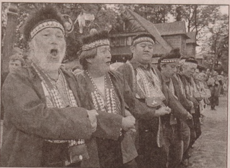
Zespół z Tajwanu prezentuje się na XXXVI Festiwalu Folkloru Ziemi Górskich w Zakopanem. Barwny korowód ponad 40 zespołów z całego świata uczestniczących w festiwalu przeszedł w niedzielę ulicami Zakopanego.

– Duża część postulatów SdPi z kontraktu zawartego z premierem Markiem Belką nie została jeszcze zrealizowana – stwierdził w niedzielę Marek Borowski. Na konferencji prasowej w sejmie, podsumowującej dwa miesiące, jakie upłynęły od decyzji SdPi o poparciu rządu, Borowski powiedział, że gdyby w poniedziałek powtórnie głosowane było wotum zaufania dla rządu, to jego partia takiego wotum by nie udzieliła. Zaznaczył, że prace rządu posuwają się w dobrym kierunku, a SdPi pozytywnie ocenia politykę kadrową rządu. Jako trafne decyzje premiera wymienił nominację Andrzeja Ananica na szefa AW i odwołanie osób pełniących funkcje posełskie ze stanowisk sekretarzy stanu. Zarzucił jednak rządowi niezrealizowanie postulatów dotyczących: większej jawności deklaracji majątkowych w administracji, informowania o śledztwach prowadzonych przeciwko funkcjonariuszom publicznym oraz wzmocnienia prawa umożliwiającego egzekucję alimentów. (cza)