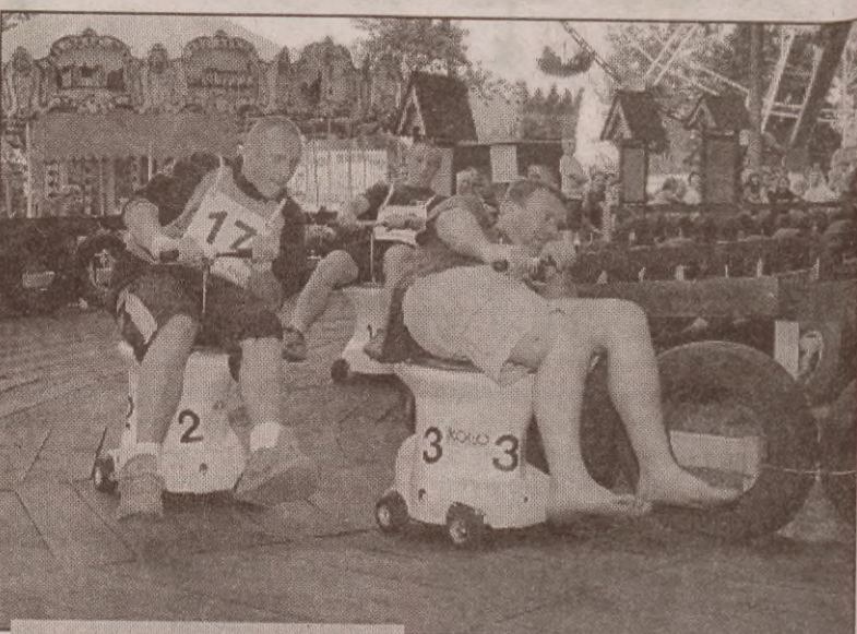
Zawodnicy na trasie wyścigu w 5. Mistrzostwach Polski w jeździe na muszlach kłozetowych. Zawody zostały zapisane w Kronice Polskich Rekordów i Osobliwości, a każdy uczestnik zawodów otrzymał również prawo jazdy na kłozet.

Jak podaje CBOS, po odnotowanym w czerwcu i lipcu wzroście poczucia bezpieczeństwa zatrudnienia, w sierpniu nastąpił jego spadek. Ponad połowa zatrudnionych (55 procent) nie obawia się utraty pracy. Do 40 procent wzrosła liczba tych, którzy liczą się z taką możliwością. (cza)