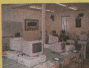
Jedna z sal wykładowych

zaprasza do podjęcia nauki na kierunkach: