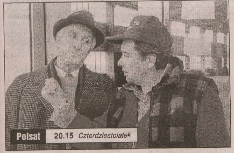
Polsat 20.15 Czwadziestolatek

TVP 1, godz. 23.35 ŻYCIE W ZAWIESZENIU Tytułowe „życie w zawieszaniu” wie dzie grupa włoskich imigrantów, mieszkających pod koniec lat 80. w paryskiej dzielnicy Belleville. Z pozoru żyjący bezkonfliktowo, niezłe ustawieni, ludzie ci skrywają prawdę o swojej przeszłości, kiedy to działali w lewackich organizacjach terrorystycznych. Jednym z nich jest Dario, mężczyzna po czterdziestce, pracownik wyższego szczebla w dużej firmie. Na jego ślub z Fabienne, towarzyszką życia od wielu lat, przyjeżdżają z Rzymu ojciec Daria i młodszy brat przyrodni, Jacopo. Ojciec po paru dniach wraca do domu - trudno mu znaleźć porozumienie ze starszym synem, obaj mają do siebie zbyt wiele pretensji o różne wydarzenia sprzed lat. Natomiast Jacopo, niespełna trzydziestoletni początkujący dziennikarz, postanawia zostać w Paryżu nieco dłużej. Chce lepiej poznać brata, którego nie widział od czasów dzieciństwa i który dotąd stanowił dla niego postać nieco mityczną, idealizowaną i podziwianą. W dodatku chłopak zaprzyjaźnia się z 10-letnią Olivią, córką Daria, nawiązuje też intymną znajomość z piękną kobietą. Zetknięcie z młodszym bratem prowadzącym, jak się wydaje, zwyczajne, proste, szczęśliwe życie, zaburza spokój Daria z takim trudem budowany przez niego w celu zerwania z burzliwą, niebezpieczną przeszłością. Okazuje się jednak, że i Jacopo ma swoje tajemnice.