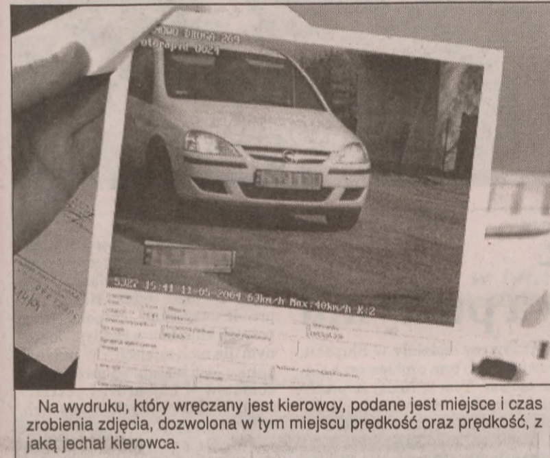
Na wydruku, który wręczany jest kierowcy, podane jest miejsce i czas zrobienia zdjęcia, dozwolona w tym miejscu prędkość oraz prędkość, z jaką jechał kierowca.