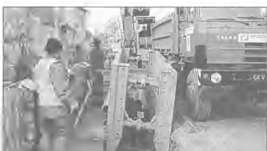
Fot. Andrzej Gurba