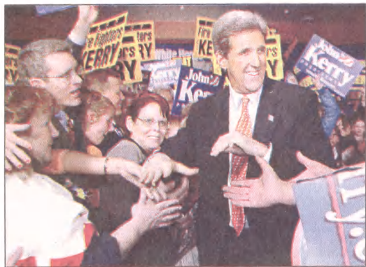
Senator John Kerry (na zdjęciu) podczas wczorajszego wiecu wyborczego w Charleston, w stanie West Virginia, ogłosił oficjalnie swe zwycięstwo w wyścigu o nominację na kandydata Partii Demokratycznej na prezydenta USA.