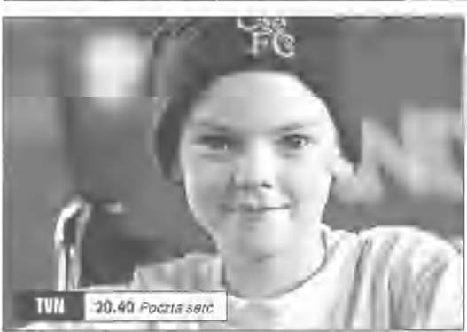
30.40 Początek serialu