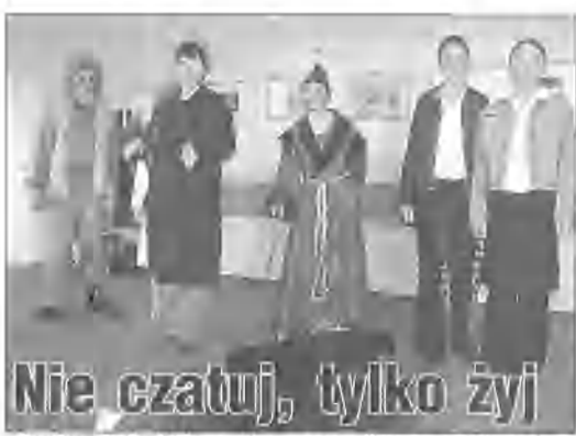
Nie czatuje, tylko żyje