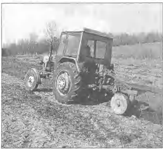
Rolnicy wykorzystują ładną pogodę do prac polowych, tak jak gospodarz w Zadrach (gm. Miastko), który po zaoraniu zasadzi na hektarze ziemi ziemniaki. (ang)