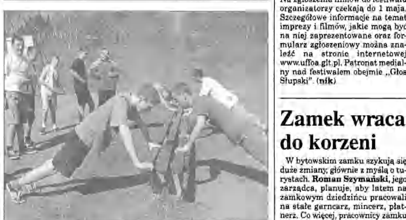
Słoneczna pogoda zachęca do organizowania na świeżym powietrzu lekcji wychowania fizycznego. Miasteczko licealiści z pierwszej klasy pod okiem nauczyciela ćwiczyli na boisku m.in. pompki i przysiadki. (ang)