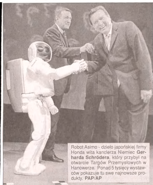
Robot Asimo - dzieło japońskiej firmy Honda wita kanclerza Niemiec Gerharda Schrödera, który przybył na otwarcie Targów Przemysłowych w Hanowerze. Ponad 5 tysięcy wystawców pokazuje tu swe najnowsze produkty.

O STATECZNIE w wyniku tej trwającej miliony lat operacji nasza planeta powinna się znaleźć za orbitą Marsa. Tam, twierdzą astronomowie z kalifornijskiej uczelni, byłaby całkowicie bezpieczna. Nawiasem mówiąc, istnieje i taki scenariusz, który zakłada, że w razie niebezpieczeństwa ludzkość porzuci Ziemię i przeprowadzi się na Czerwoną Planetę, która w tym czasie przekształcona zostanie w glob zdalny do zamieszkania. A zatem, co lepsze: zmiana orbity Ziemi czy przeprowadzka na Marsa? Na szczęście, to nie my będziemy musieli rozstrzygnąć ten dylemat. (SN)