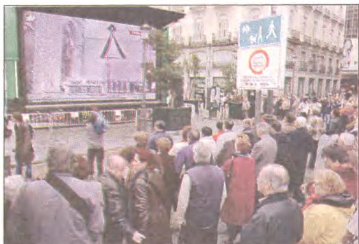
Hiszpanie biorący udział w uroczystościach żałobnych oglądali wczoraj na telebimie, na placu przed madrycką Katedrą Almudena, telewizyjną transmisję z ceremonii żałobnej ku czci ofiar zamachów z 11 marca.