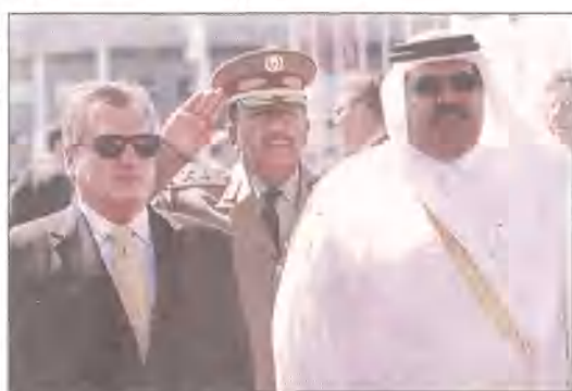
Prezydent Polski Aleksander Kwaśniewski i emir Kataru, szehk Hamad bin Khalifa as-Sani podczas ceremonii powitanej na lotnisku w mieście Dauha w Katarze. Prezydent Polski już od kilku dni jest w podróży po krajach arabskich.

Nagroda Karola Wielkiego, przyznawana od 1960 roku honoruje zasługi dla Europy i jedności europejskiej. W tym roku otrzyma ją również przewodniczący Parlamentu Europejskiego Pat Cox . (mro)