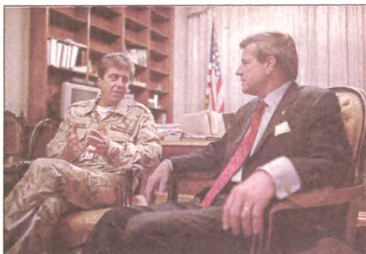
Bulgarski prezydent Georgi Parwanow powiedział podczas swojej wizyty w Bagdadzie, że jego kraj nie zamierza wycofać swoich żołnierzy z Iraku. Na zdjęciu: prezydent Bułgarii spotkał się w Bagdadzie z amerykańskim administratorem w Iraku Paul'em Bremerem