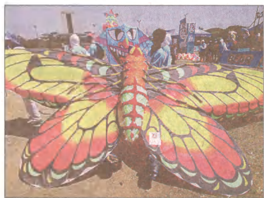
Entuzjaści latawców koło kolorowego latawca w kształcie motyla podczas dorocznego festiwalu latawców sponsorowanego przez Nestle w parku Rizal w Manili.