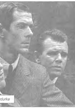
TVP 1 21.15 Ferdynand