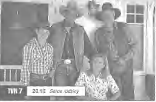
TVP 7 20.10 Serce rodziny

TVP 2, godz. 23.30 ZABOJCA KOLACJA Czarna komedia, pełna szalonych pomysłów rodem z burleski. Jej przewrotny humor doceniono na festiwalu filmowym w Chicago, przyznając jej tam nagrodę FIPRESCI, a także na Paryskim Festiwalu Filmowym, gdzie otrzymała nagrodę specjalną jury. 35-letnia Claire Doste jest atrakcyjną kobietą, która ma piękną, rozległą mieszkanie, osiąga liczne sukcesy zawodowe. Gorzej układają się jej prywatne sprawy. Claire spotyka się z czterema mężczyznami, ale żaden nie pasuje w pełni do jej ideału i dlatego pannie Doste tak trudno się zdecydować, którego z nich poślubić i uczynić ojcem swoich dzieci. W dniu 35. urodzin dochodzi jednak do wniosku, że najwyższa pora uporządkować życie. Za podstępem aważ siostry, Alice, zaprasza wszystkich kochanków na kolację w nadziei, że w końcu dokona wyboru. Niestety, chwila zamieszania w kuchni między nią i jednym z kandydatów kończy się śmiercią nieszczęsnego Sachy. Przerazona Claire usiłuje ukryć jego ciało tak, by pozostał mężczyźni niczego nie zauważyli.