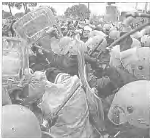
Policja włoska przeprowadziła wczoraj akcję przeciwko blokującym wejście pracownikom fabryki Fiata w Meli, aby umożliwić wznowienie produkcji w zakładzie. Robotnicy od tygodnia protestują przeciwko niskim pensjom i złym warunkom pracy i blokują bramę fabryki, nie pozwalając podjąć pracy tym, którzy gotowi byłiby to zrobić. PAF