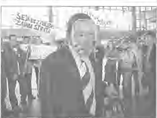
Przebrany za Andrzeja Leppera członek Młodych Demokratów w czasie happeningu stowarzyszenia pi. „Pożegnanie z Lepperm”, który został zorganizowany na Dworcu Centralnym w Warszawie.

Niezapisanie dziecka do zerówki może się źle skończyć i dla rodziców, i dla szkoły. Zgodnie z prawem, na- uczyciele muszą tak długo szukać sześciolatka, aż go znajdą. Rodzice zaś mogą zapłacić grzywnę. (mro)