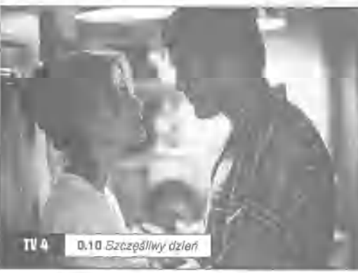
TV 4 0.10 Szczęśliwy dzień