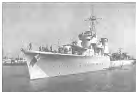
Okręt - muzeum ORP „Błyskawica” po gruntownym odnowieniu powrócił w Gdyni na morze w nowym kamuflażu niszczyciela z przelotu lat 1941-1942. Cumujący przy Skwerze Kościuszki w Gdyni okręt udostępniony będzie zwiedzającym od pierwszego maja.

Okulistyka gościła na rankingo- wej liście już w zeszłym roku, zajęła wówczas 19. miejsce. W tym roku znalazła się na dziesiątym wó- ród 16 placówek. Na dziesiątym miej- scu – pośród 21 ośrodków – upla- nowała się koszańska kardiologia. Także awansowała, bo w ubiegłym roku zajmowała 16. pozycję. Laryn- gologia zajęła trzynaste miejsce w wykazie najlepszych polskich od- działów i klinik laryngologicznych. Niestety, w rankingu „Newwe- ek” nie znaleźliśmy żadnego od- działu szpitalnego z byłego woje- wództwa śląpskiego. (l)