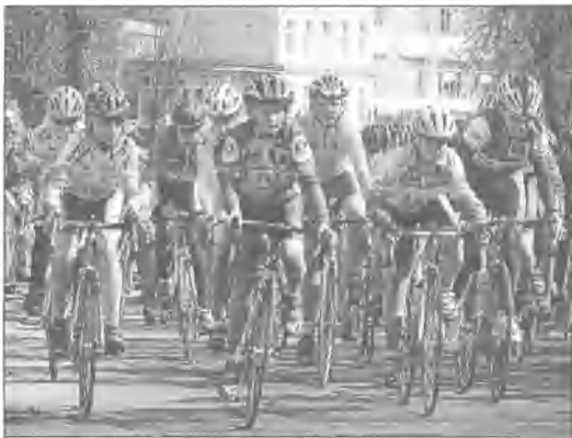
Około 200 kolarzy z całego kraju wzięło udział w wyścigu kolarskim o puchar burmistrza Miastka. Rywalizowano w siedmiu kategoriach na 30-kilometrowych pętach. Trasa wiodła z Miastka przez Wolczę, Kamnicę, Bobięcino, Kawczę i Łodzier. Dopisała pogoda, niestety, mniej kibice. (ang)