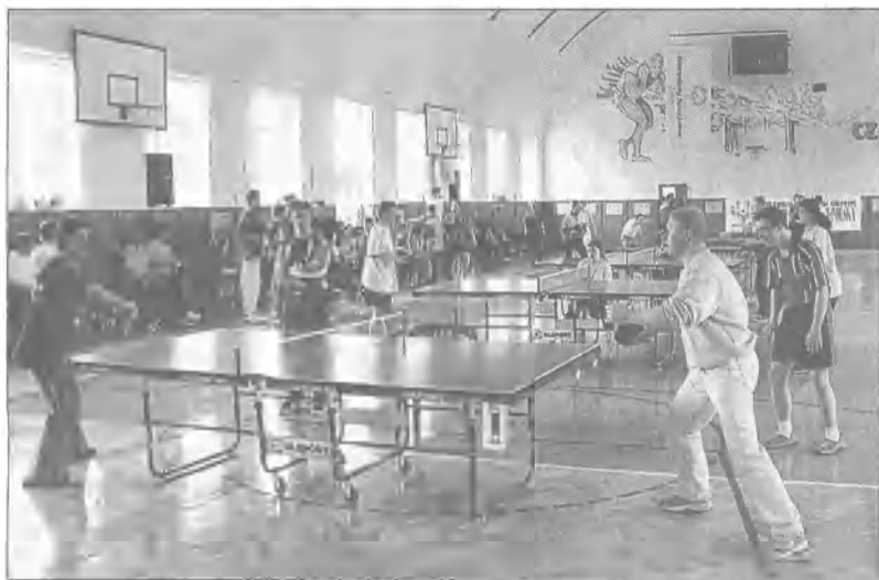
W hali Ośrodka Sportu i Rekreacji w Człuchowie rozegrano Pomorski Turniej Tenisa Stołowego „Olimpiad Specjalnych Polska”. Do rywalizacji stanęli podopieczni specjalnych ośrodków szkolno-wychowawczych i domów pomocy społecznej, w sumie ponad 70 zawodniczek i zawodników. O medale i nagrody zmagali się w kilku grupach sprawnościowych tenisistów z upośledzeniami umysłowymi w stopniu umiarkowanym, znacznym i głębokim. (JG)