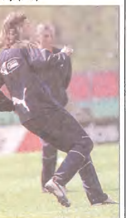
Na zdjęciu: Kamil Kosowski na stadionie Legii podczas treningu kadry przed meczem z Irlandią. W głębi trener Paweł Janas.

Kolejne zmiany w kadrze Irlandii na towarzyski mecz z Polską (28 kwietnia). W spotkaniu, które odbędzie się w Bydgoszczy, nie weźmie udziału aż siedmiu zawodników. Nie zagrają: Paddy Kenny, Stephen Carr, Rory Delap, Kevin Kilbane, Gary Breen, Jason McAteer i Damien Duff. W ich miejsce selekcjoner Brian Kerr powołał: Stevena Reida, Jonathana Douglasa (obaj Blackburn Rovers) oraz Alana Quinna (Sheffiel United). Ostatecznie irlandzka kadra będzie liczyła 20 piłkarzy. (wk)