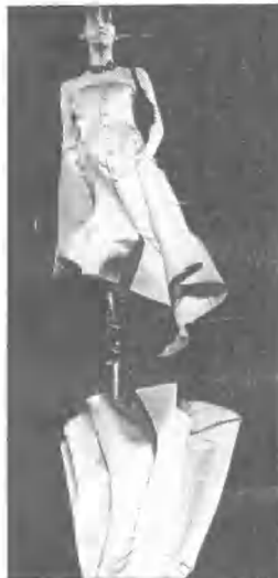
Modelka odbija się w tafli wybiegu na pokazie kolekcji jesienno-zimowych 2005 projektanta Giorgio Armaniego w Hongkongu.

W średniowieczu jedynie mężczyźni mogli nosić diamenty, które były symbolem ich odwagi i męskości. Dopiero w 1477 roku, kiedy arcyksiążę austriacki Maksymilian podarował diamentowy pierścionek swojej narzeczonej Marii Burgundzkiej, diamentowe kamienie stały się sposobem na zdobywanie kobiecych serc. (asy)