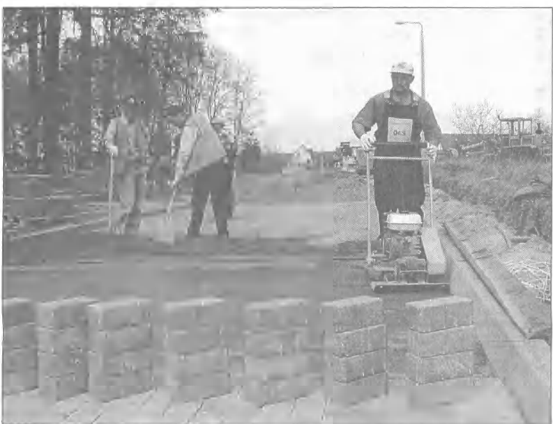
Przy okazji modernizacji ul. Młyńskiej w Przechlewie przed cementarzem komunalnym powstaje duży parking i szeroka droga dojazdowa z asfaltem nawierzchnią. Wykonawcą robót jest człuchowska spółka „Perde”. (JG)

Zarząd Wojewódzkiego Funduszu Ochrony Środowiska i Gospodarki Wodnej w Gdańsku umorzył gminie Bytów 320 tysięcy złotych z pożyczki, jaką samorząd zaciągnął w lipcu 2003 roku na budowę kanalizacji sanitarnej w Udorpiu i Gostkowie. Kwota ta stanowi 40 procent pożyczki. (ang)