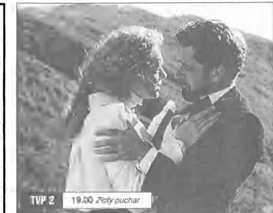
TVP 2 19.00 Złoty puchar