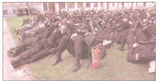
Na zdjęciu: policjanci przed hotelem Victoria

Zerowa strefa bezpieczeństwa, czyli m.in. Krakowskie Przedmieście, okolice hotelu Sofitel Victoria, Sejmu i Senatu, Parku Łazienkowskiego, Szkoły Głównej Handlowej, uznana została za najlepiej strzeżone obecnie miejsce w Europie. Wejście mogą tam jedynie goście i mieszkańcy tych terenów, którzy mają na to dokumenty. (mro)