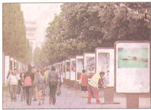
Paryżanie i turyści mogą na Polach Elizejskich obejrzyć wystawę fotograficzną, prezentującą dziesiątkę krajów, które 1 maja staną się członkami Unii Europejskiej.

Rozpoczął się szczyt gospodarczy w Warszawie