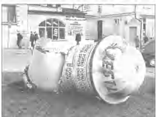
W nocy wandalę zniszczyli słup ogłoszeniowy przy ulicy Armii Krajowej w Miastku. Musiało być ich kilku, bo słup przymocowany był do ziemi mocnymi pretami. Straty wyniosły kilka tysięcy złotych. (ang)

Bytów. Z powodu przebudowy skrzyżowania ulic Wolności i 1 Maja, została zamknięta część ulicy 1 Maja, od ul. Sikorskiego, więc nie ze skrzyżowaniem z ul. Pochyła, aż za skrzyżowanie z ul. Kościuszki. Objazd w kierunku Kościerzyny prowadzi ulicami: Dworczyńska i Wolności. Natomiast w kierunku Kartuz biegnie ulicami: Dworcowa, Bauera, Kochanowskiego, Sikorskiego i Gdańska.