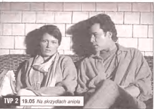
TVP 2 19.05 Na skrzydłach anioła

TVP 1, godz. 23.40 UNABOMBER Film, którego fabułę oparto na autentycznych wydarzeniach, opowiada historię długiego śledztwa, które zakończyło się skazaniem terrorysty zwanego Unabomberem na czterokrotną karę dożywocia oraz dodatkowe 30 lat więzienia. Pierwszy raz terrorysta dał o sobie znać w listopadzie 1979 roku. Na pokładzie samolotu specjalnie skonstruowana paczka wywołała pożar w przedziale bagażowym. Z powodu zatrucia dymem hospitalizowano 12 osób. Wkrótce inne bomby, przesłane pocztą, raniły pracowników uniwersytetów, powodując groźne obrażenia rąk i twarzy oraz trwałe kalectwo. Zadania wytopienia terrorysty - z powodu okonywania ataków na uniwersytety i obiekty związane z lotnictwem zwanego Unabomberem - podejmuje się inspektor Poczty Stanów Zjednoczonych, Ben Jeffries, stojący na czele specjalnie powołanej grupy zadaniowej. Jego uwagę zwraca staranne, ręczne wykonanie drewnianych skrzynek na bomby. Wieloletnie śledztwo nie przynosi jednak rezultatów. Terrorysta zmienia taktykę, podrzuca bomby w różnych miejscach kraju.