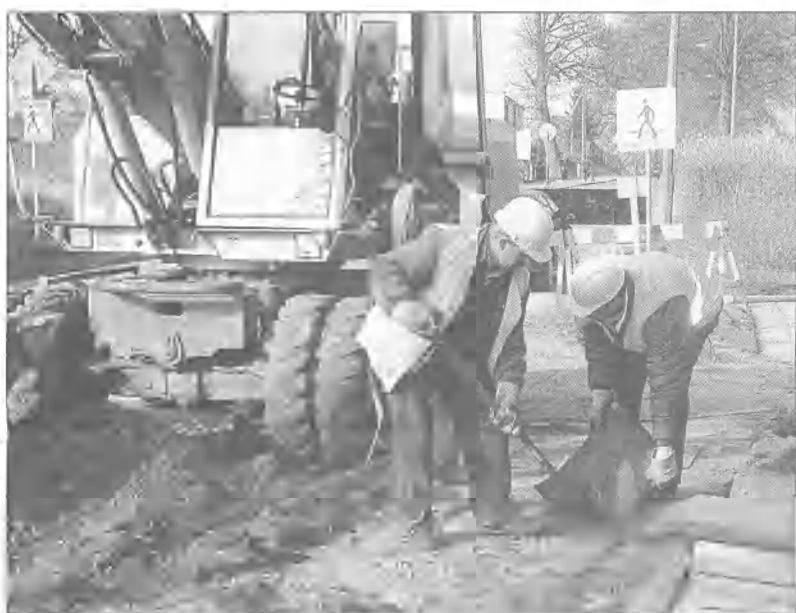
Firma „Eko-Instal” ze Studzienic zakończyła prace przy budowie kanalizacji sanitarnej na ulicy Kolejowej w Miastku. Teraz sieć ukladana jest wzdłuż ulicy Kaszubskiej, a także w pobliskiej Wolczy Wielkiej. Inwestycja zakończona zostanie w listopadzie tego roku. (ang)