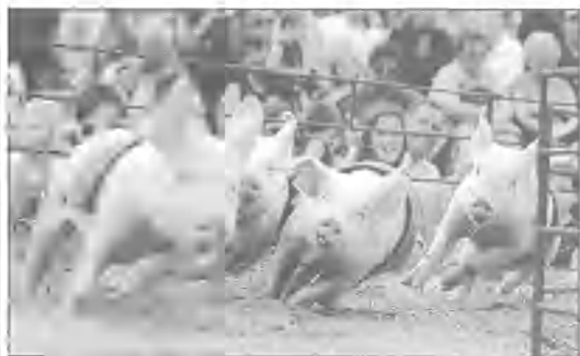
Jak co roku przed Wielkanocą w Sydney w Australii ku uciesze mieszkańców odbyły się wyścigi świnek.