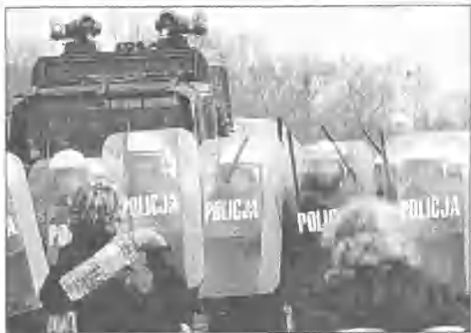
9,8 mln złotych z rezerwy budżetowej przeznaczył rząd dla ministra spraw wewnętrznych i administracji oraz wojewody mazowieckiego na zapewnienie bezpieczeństwa i opieki medycznej podczas obrad Europejskiego Forum Ekonomicznego w Warszawie. Szczyt odbędzie się od 28 do 30 kwietnia. Weźmie w nim udział około 1200 osób. (mro)

Na zdjęciu: ćwiczenia oddziałów prewencji policji przed zbliżającym się szczytem Europejskiego Forum Gospodarczego