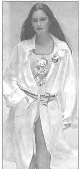
Modelka prezentuje strój z kolekcji Froła Romanowa podczas pokazu mody w Moskwie.