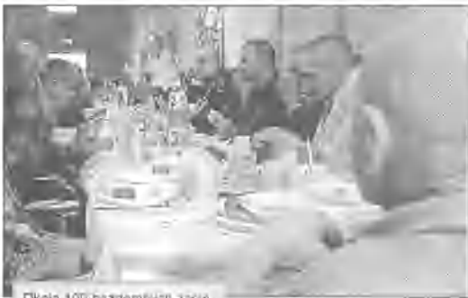
Około 100 bazylantów zebrało się do świątecznej wielkanocnej w świątyni świętego Brata Alberta w Łodzi.

townicze. Wybuch zastał górników na głębokości około 700 metrów. Ratownicy próbowali się do nich dostać zarówno bezpośrednio, jak i przez inny szary. Nie mogli jednak używać maszyn z obawy przed kolejnymi wybuchami. W Kuzbasie, jednym z największych zagłębi węglowych w Rosji, często dochodzi do wypadków w kopalniach. Ocenia się jednak, że sobotni wybuch to największa tragedia górnicza od siedmiu lat. (ho)