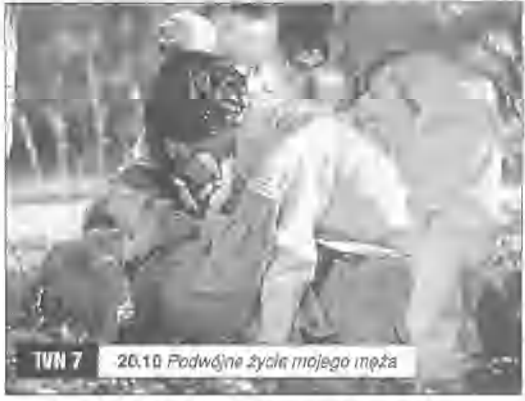
TVP 7 20.10 Podwójne życie mojego męża