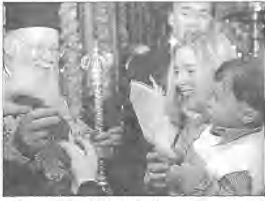
Patriarcha ekumeniczny Konstantynopola Bartłomiej w wężcu wielkanocnym. W tle: wspaniały obraz z wielkanocnego nabożeństwa w cerkwi w Stambule. Dzięki zbliżeniu dat kalendarza gregoriańskiego i juliańskiego w tym roku katolicy i prawosławni obchodzą Wielkanoc równocześnie.