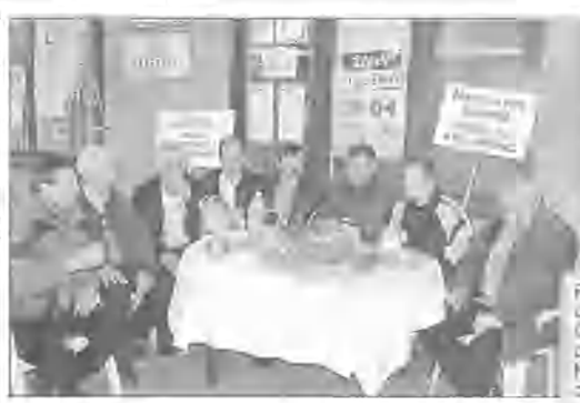
Prosząc o pomoc, żołnierze w obozie w Faludży. W tle: wspaniały obraz z wielkanocnego nabożeństwa w cerkwi w Stambule. Dzięki zbliżeniu dat kalendarza gregoriańskiego i juliańskiego w tym roku katolicy i prawosławni obchodzą Wielkanoc równocześnie.

Na stołach nie brakowało nie tylko jajek, ale i ciasteczek, kawy, herbaty, a także wina. Wśród żołnierzy, którzy przyjechali do Iraku, było wielu z rodziny. Wśród nich były także kobiety i dzieci. Wśród nich były także kobiety i dzieci. Wśród nich były także kobiety i dzieci.