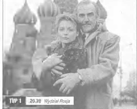
TVP 1 20.30 Wydził Rosja