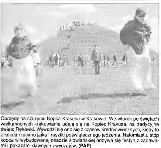
Obchody na szczycie Kopca Krakusa w Krakowie. We wtorek po świętach wielkanocnych krakowianie udają się na Kopiec Krakusa, na tradycyjny święty Rękawki. Wywodzi się ono się z czasów średniowiecznych, kiedy to z kopca rzucano jajka i resztki poświątecznego jedzenia. Natomiast u stóp kopca w wybudowanej osadzie słowiańskiej odbywa się festyn z zabawkami i pokazami dawnych zwyczajów. (PAP)