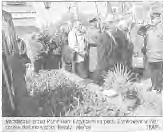
Na zdjęciu: przed Pomnikiem Katyńskim na placu Żołnierzy w Warszawie zdołano wczoraj śpiewać i wylać łzy

Zbrodnia katyńska określa się wymordowanie przez NKWD ponad 25 tysięcy polskich jeńców, wziętych do niewoli po agresji Związku Radzieckiego na Polskę. Prawda o wymordowaniu ponad 25 tysięcy polskich jeńców była ukrywana przez komunistyczne władze przez ponad pół wieku. Dopiero 13 kwietnia 1990 roku Związek Radziecki przyznał, że zbrodnię popełniło NKWD. (ho)