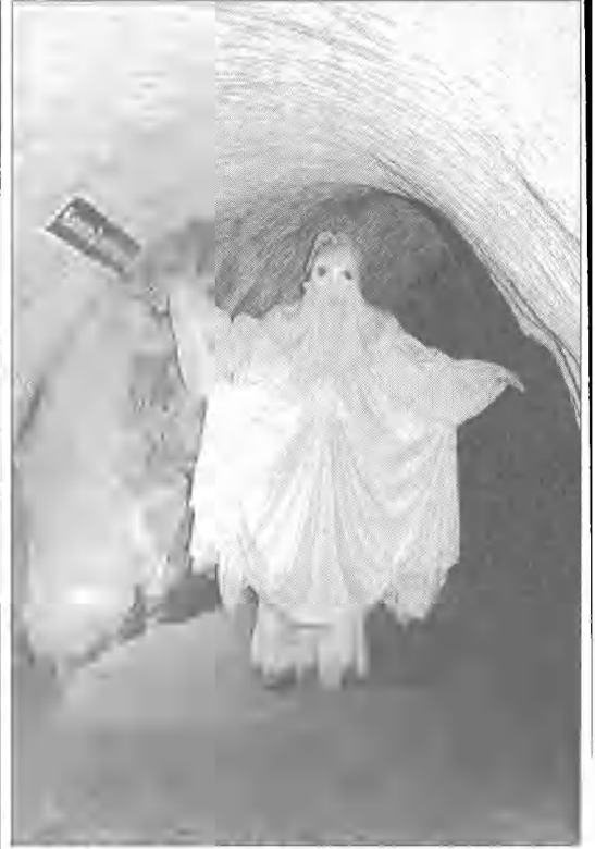
Władca kredowych podziemi Duch Bieluch w podziemiach kredowych w Chelmie. Podziemia, w których królują Bieluch, to pozostałość kilku wieków eksploatacji pod miastem kredy pisańczej. Kopalnia kredy była jedną w Europie, gdzie biały surowiec pozyskiwany był do celów budowlanych, piśmienniczych, medycznych i innych. Służyły one również mieszkańcom jako miejsce schronienia podczas napadów, wojen i grabieży.