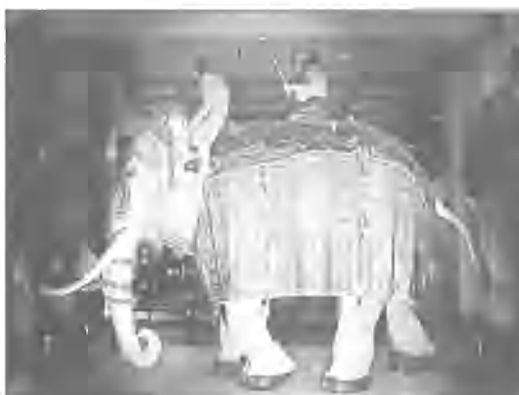
W muzeum w Leeds w Wielkiej Brytanii znajduje się unikalna broń wykonana na przełomie XVI i XVII wieku w północnych Indiach dla azjatyckiej szlacheckiej, składająca się pierwotnie z blisko 8450 metalowych płytek i ważąca 159 kg. Broń trafiła do Europy w 1801 r. przywieziona przez żonę lorda Clive'a, brytyjskiego gubernatora Madrasu. Mimo że obecnie brakuje jej części płytek i waży tylko 118 kg, została uznana za „największą zbroję dla zwierzęcia” i trafiła do Księgi Rekordów Guinnessa.

Do jednego ze schronisk w Berlinie trafił 6-letni kot ważący 18,5 kg. Czarno-biały Mikesch dostawał dziennie aż 2 kg mięsa mielonego i w wyniku tej diety jest tak gruby, że musi odpooczywać po zrobieniu zaledwie kilku kroków. Zwierz zostało odebrane leciwemu właścicielowi, który trafił do domu opieki. Mikesch ma problemy z sercem i stawami, nie potrafi samodzielnie się myć i po kilku krokach pada wyprzedzany, ponieważ serce nie pracuje normalnie i kot nie może oddychać. (sys)