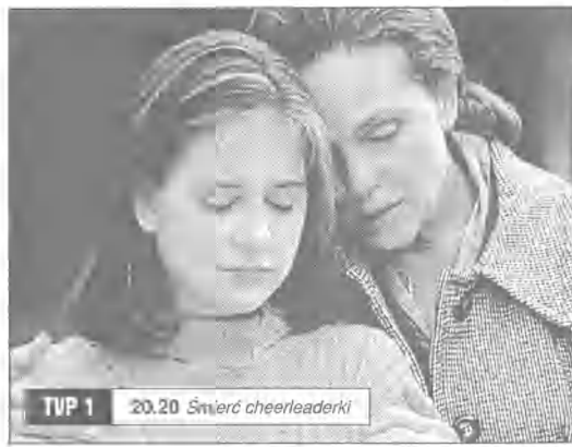
TVP 1 20.20 Śmierć cheerleaderki