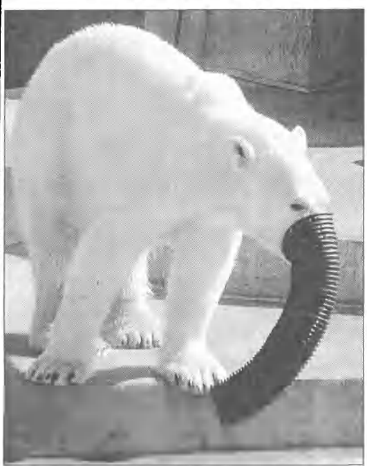
Zabawa zamieniła misia polarnego w... słonią, w ogrodzie zoologicznym Como Park w St. Paul.