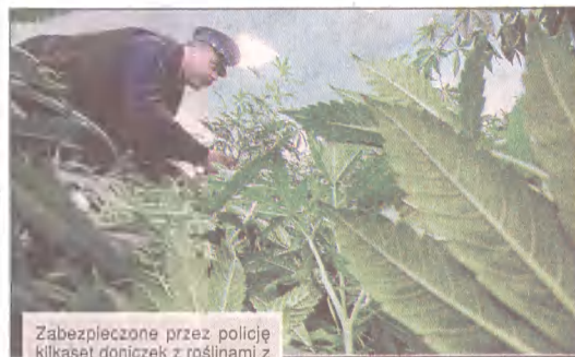
Zabezpieczone przez policję kilkadziesiąt doniczek z roślinami z profesjonalnej plantacji konopi indyjskich zlikwidowanej przez policjantów z Koluśzek (woj. łódzkie). Zatrzymano 54-letniego właściciela poseszi, z zawodu ogrodnika. Hodowla znajdowała się na piętrze budynku mieszkalnego w miejscowości Tadzcin koło Koluśzek.

W wyniku wypadku w kopalni Rudna na Dolnym Śląsku rannych zostało dwóch górników. Dzięki kilkogodzinnej akcji ratowników obaj poszkodowani zostali wydobyti spod skał. Mężczyźni zostali pod nimi uwięzieni w wyniku obrywania się kopalnianego stropu. Jeden z nich z niegroźnymi obrażeniami trafił do szpitala. (mro)