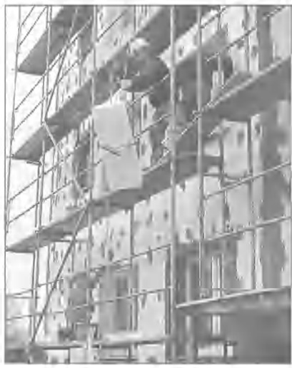
Bloki przy ulicy Piastowskiej w Miastku zarządzane są przez wspólnotę mieszkaniową. Widać już tego pozytywne efekty. W ubiegłych latach ocieplone zostały dwa budynki, a teraz przyszedł czas na trzeci. Prace wykonuje firma Zdzisława Grabowskiego z Miastka. (ang)