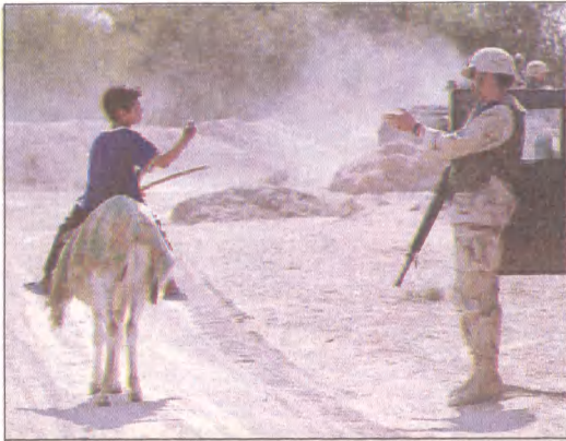
Iracki chłopiec na osie rozmawia z amerykańskim żołnierzem, patrolującym przedmieścia Nadżafu.