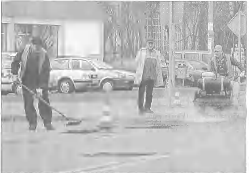
Kierowcy przejeżdżający przez Lębork powinni zachować szczególną ostrożność na ulicach Krzywoustego i Zwycięstwa. Pracownicy lęborskiego Przedsiębiorstwa Robót Drogowych rozpoczęli wiosenne łatanie dziur w nawierzchni jezdni. Przypomnijmy, że już niedługo w tym miejscu rozpocznie się budowa tunelu pod przejazdem kolejowym. (ars)