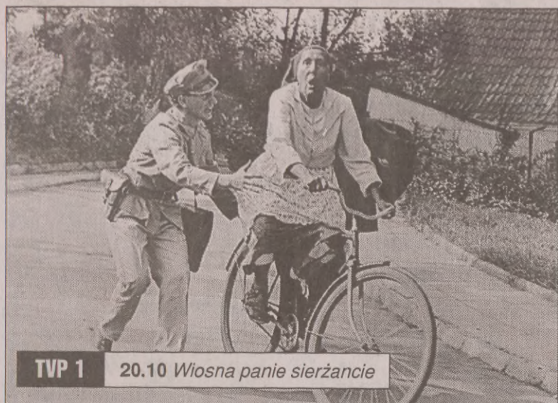
TVP 1 20.10 Wiosna panie sierżancie

Gdy deszcze ustają, Ihei i Tayo ruszają w dalszą drogę. Biorąc udział w przypadkowej bójce między dwoma samurajami, Ihei zwraca swoim kunstem uwagę miejscowego feudała, Shigeaki, który wysłuchawszy jego historii, postanawia go zatrudnić jako nauczyciela fechtunku swojej straży przybocznej. Wpływowi dworzanie nie są jednak zachwyceni faktem, że „przybłąda” miałby ich czegośkolwiek nauczać i cieszyć się względami pana.