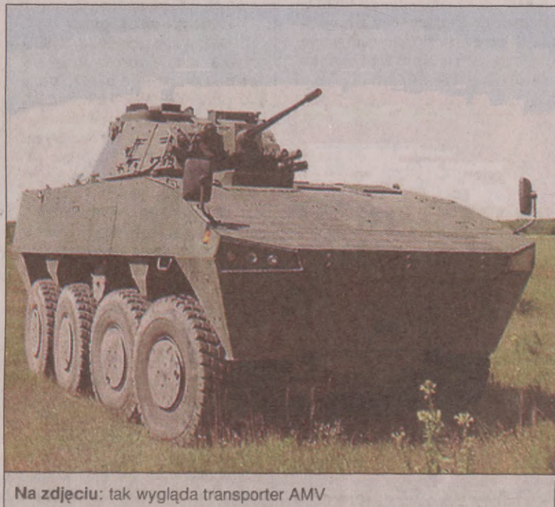
Na zdjęciu: tak wygląda transporter AMV

Firma z podślupskiego Głębina jest w gronie 151 krajowych przedsiębiorstw, które skorzystają z offsetu przy zakupie transportera kołowego AMV dla polskiej armii. Wojsko dostanie 690 wozów bojowych, a łączna wartość tego kontraktu opiewa na 5 miliardów złotych.