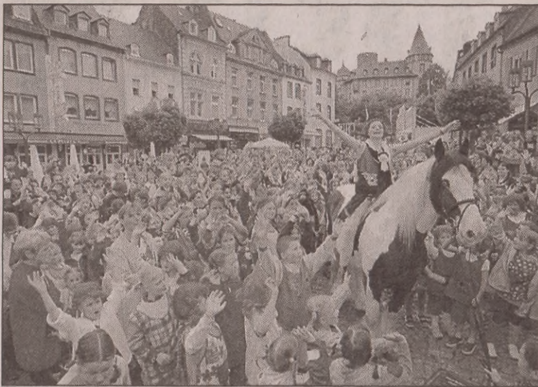
Na głównym placu we wsi Mayen (Niemcy) 753 dzieci przebranych za Pipi Pończoszkę próbowało pobić rekord Guinnessa. (PAP)