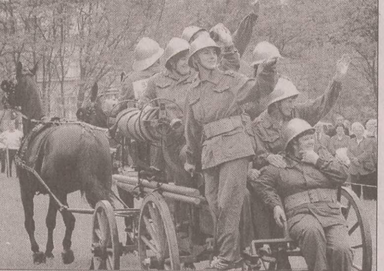
Jedyna w zawodach drużyna żeńska z Widowa koło Gliwic w trakcie zawodów. 13 drużyn strażackich, niektóre ze sprzętem pochodzącym jeszcze z końca XIX w., uczestniczyły w 1. Zawodach Sikawek Konnych na Górnym Śląsku.