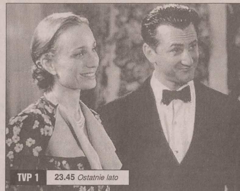
TVP 1 23.45 Ostatnie lato