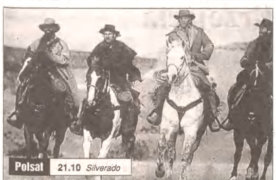
Polsat 21.10 Silverado