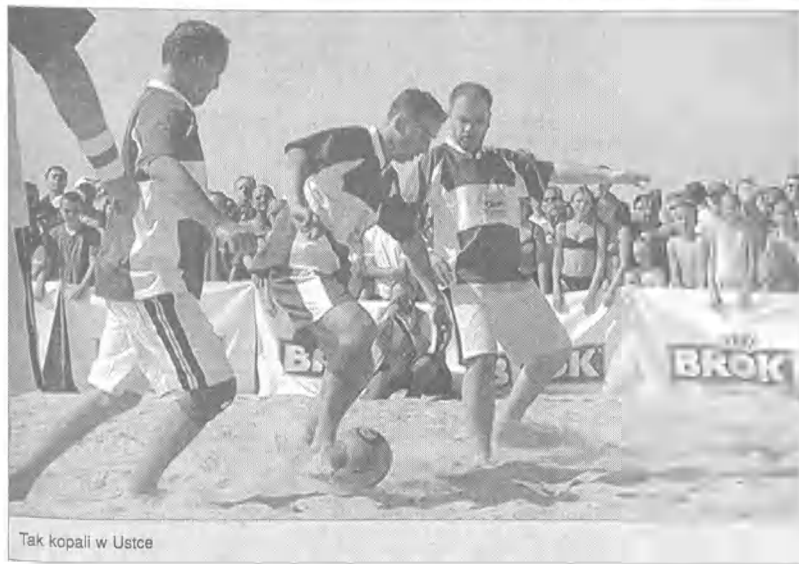
Tak kopali w Ustce