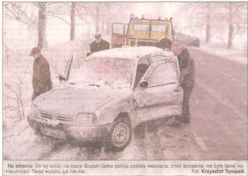
Na zdjęciu: Do tej kolizji na trasie Słupsk-Ustka policja została wezwana, choć wcześniej nie było takiej konieczności. Teraz wyboru już nie ma...

Wielu kierowców, którzy mieli kolizję lub stłuczkę, przekonało się, jak długo trzeba czekać na przyjazd policji. Czas oczekiwania na pojawienie się „drogówki” może teraz drastycznie się wydłużyć. Dlaczego? Bo z początkiem 2004 roku weszła w życie nowa ustawa o ubezpieczeniach drogowych. Zgodnie z nią, funkcjonariuszy trzeba wyzwać nawet do najbardziej błahego zdarzenia drogowego. Kierowcy i policja narzekają na nowy przepis. Firmy ubezpieczeniowe twierdzą, że to zmiłna na... lepsze.