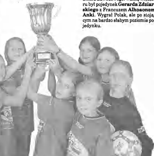
Sianowianki wygrały piłkarski turniej im. Marka Wielgusa