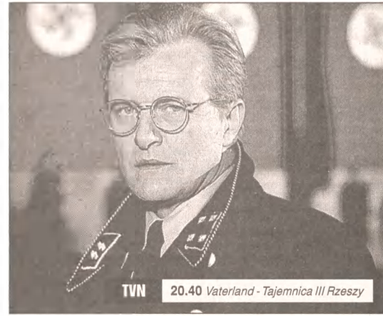
20.40 Vaterland - Tajemnica III Rzeczy