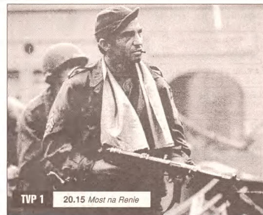
TVP 1 20.15 Most na Renie