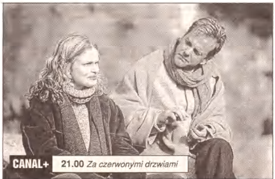
CANAL+ 21.00 Za czerwonymi drzwiami

TVP 1, godz. 12.45 LANCELOT Film wywodzący się z ducha XII-wiecznych opowieści bretańskich związanych z legendą króla Artura i rycerzy Okrągłego Stołu. Dzieło zmarłego w grudniu 1999 r. Roberta Bressona nie jest jednak adaptacją żadnego z poematów Chrétiena de Troyes, jednego z głównych autorów, którzy spisali te opowieści. Francuskie pieśni rycerskie i bretańskie romanse podbiły cały świat chrześcijański i znalazły naśladowców w wielu krajach. Bresson od dawna myślał o wykorzystaniu w filmie tych wzorów. Scenariusz „Lancelota” napisał jeden z głównych autorów, który podejmował próby znalezienia funduszy, by przenieść swą wizję średniowieczna na ekran. Zrealizował „po drodze” siedem innych filmów, m.in. „Ucieczkę skazanka”, „Proces Joanny D’Arc” i „Lagoda”. Długość „przymiarek” do nakręcenia „Lancelota” najlepiej obrazuje fakt, że ostatecznie rolę królowej Ginewy zagrała... córka kobiety wybranej pierwotnie do tej roli. W rękach mistrza Bressona średniowieczna legenda bretańska, pełna tajemnic i cudowności, zmieniła się w mroczną przypowieść o ludzkim losie, o jego poplątanych ścieżkach i szukaniu absolutu.