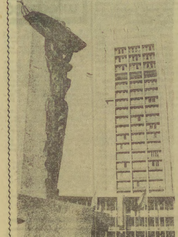
Abidżan, 850-tysięczna stolica Republiki Wybrzeża Kości Słoniowej. Na zdjęciu: pomnik Niepodległości w centrum Abidżanu.