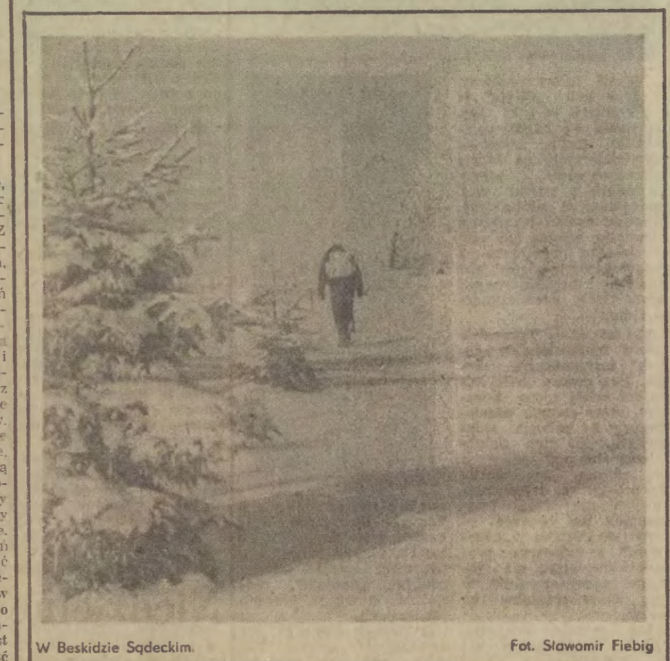
W Beskidzkie Sądceckim.

lekarzki i płynności załogi tkwią główne trudności z kadrami, a więc i wykonywaniem planów.