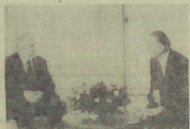
Rozmowa E. Gierka z P. Jaroszewiczem.

W dniu 7 bm. I sekretarz KC PZPR Edward Gierek odwiedził członka Biura Politycznego KC PZPR, preza Rady Ministrów PRL Piotra Jaroszewicza, przebywającego na rekonwalescencji.