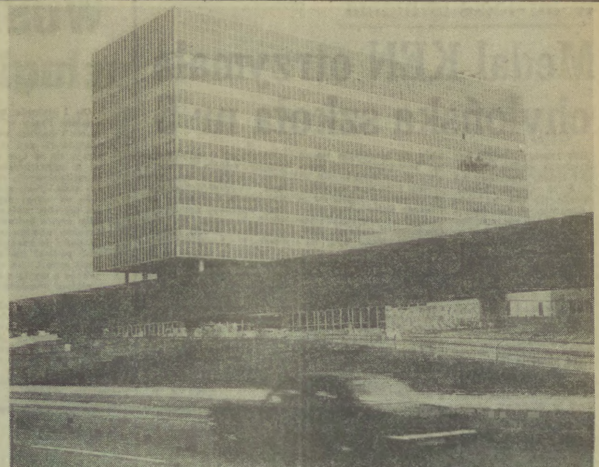
Centrum Zdrowia Dziecka.

W tym czasie mieszkańcy Oradouru, którzy walczyli w szeregach Armii Wolnej Francji, zostali zamordowani. W tym czasie mieszkańcy Oradouru, którzy walczyli w szeregach Armii Wolnej Francji, zostali zamordowani.