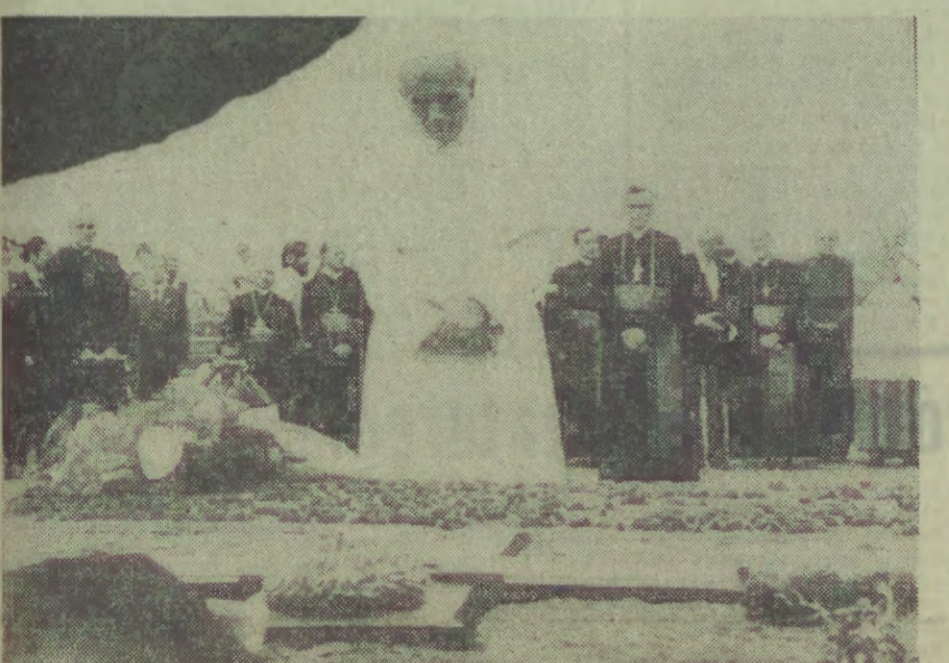
Papież Jan Paweł II na terenach byłego, hitlerowskiego obozu zagłady Auschwitz-Birkenau oddaje hołd pomordowanym wielu narodowości.

Papież JAN PAWEŁ II kontynuuje wizytę-pielgrzymkę po ojczystym kraju. W czwartek 7 bm. odwiedził Kalwarię Zebrzydowską i Wadowice — miejsce związane z jego dzieciństwem i młodością. Szczególnie podniosłymi chwilami w tym dniu wizyty-pielgrzymki papieża po Polsce były jego odwiedziny terenów b. hitlerowskiego obozu zagłady w Oświęcimiu-Brzezince, uświęconych krwią milionów ofiar niemieckiego faszyzmu. Sprawozdawcy PAP relacjonują: W KALWARIJ ZEBRZYDOWSKIEJ W godzinach porannych Jan Paweł II przybył śmigłowcem z Krakowa do Kalwarii Zebrzydowskiej, miasteczka w woj. bielskim. Towarzyszyli mu prosekretarz stanu kardynał Agostino Casaroli i metropolita krakowski, kardynał Franciszek Macharski. W pobliżu tej miejscowości