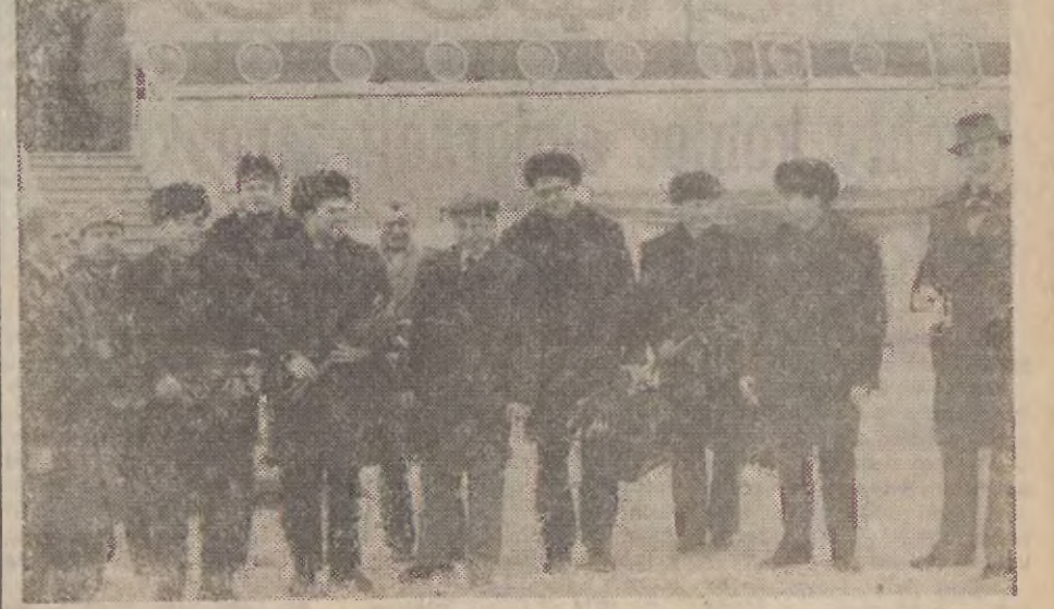
Głównomiernikiem obejrzeni znajdują się tam ekspozycje dotyczące dawnej i najnowszej historii miasta. W czasie swego pobytu na ziemi gdańskiej delegacja...