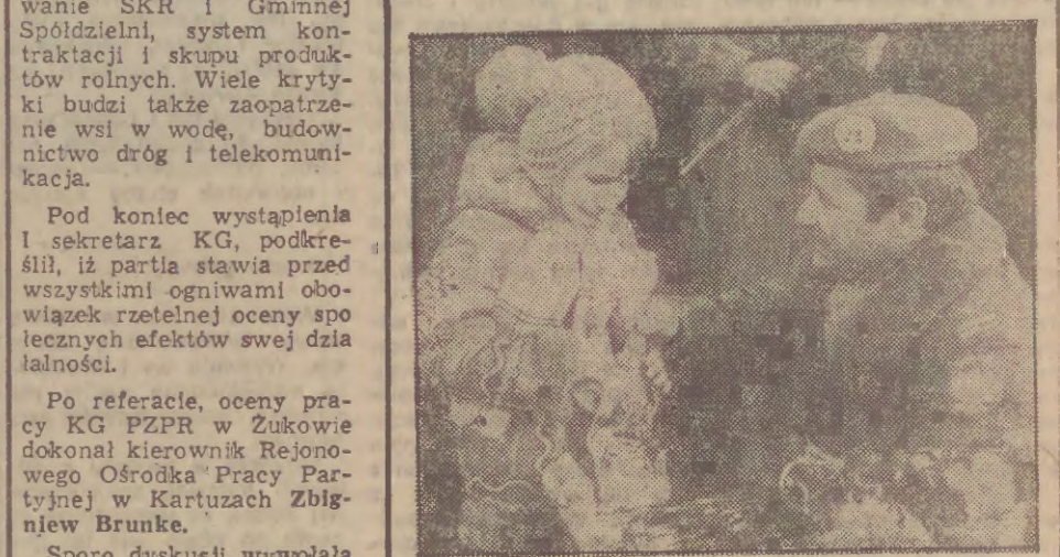
2 grudnia powrócił do kraju pierwsza grupa żołnierzy 12 Dywizji Zmechanizowanej im. AL. Zolnierce ci pełnił pokojową służbę w ramach 20 zmiany Polskiego Kontyngentu Wojskowego Dozoruńskich Sił Zbrojnych ONZ na Bliskim Wschodzie. Naz.: powitanie z rodziną na lotnisku.

Jak nam poinformował dzurny synoptyk, dziś na Wybrzeżu zachmurzenie duże z większymi przejaśnieniami, okresami opady deszczu, głównie o charakterze przelotnym. Temperatura od +3 st. do +8 st. Wiatr południowo-wschodni, umiarkowany do dość silnego.