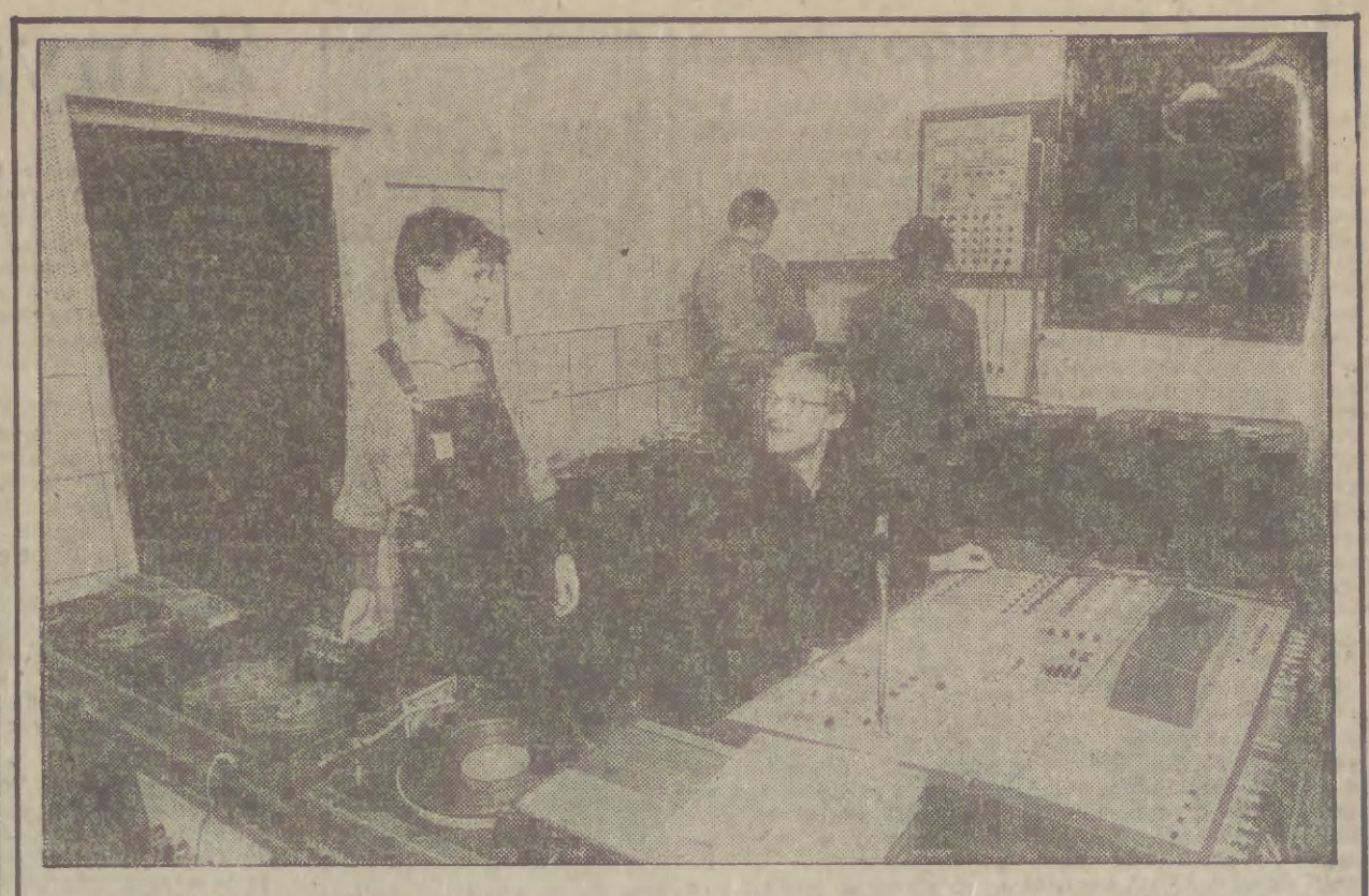
STUDENCKIE RADIO, Akademickie Radio Winogrody AR w Poznaniu znane jest w całym kraju. Za swoją działalność wielokrotnie otrzymywało ogólnopolskie wyróżnienia. Każdego dnia 40-osobowy zespół w 6 redakcjach przygotowuje 2-godzinny program składający się z aktualnych wiadomości, audycji sportowych, muzycznych oraz programów społeczno-politycznych. Słuchający go studenci w 7 akademiach. Pod jego redakcją powstaje również Magazyn Studencki emitowany w lokalnym programie Polskiego Radia.

Gdyni i Gdańska. Z polskich portów do Czechosłowacji nie było już daleko. O zakończeniu II wojny światowej Czechosłowacja otrzymała — podobnie jak Polska — kilka statków typu „Liberty”. Początkowo reakcyjne kole w rządzie Benesa sprzyjały się rozwojowi morskiej floty. Dopiero więc od 1948