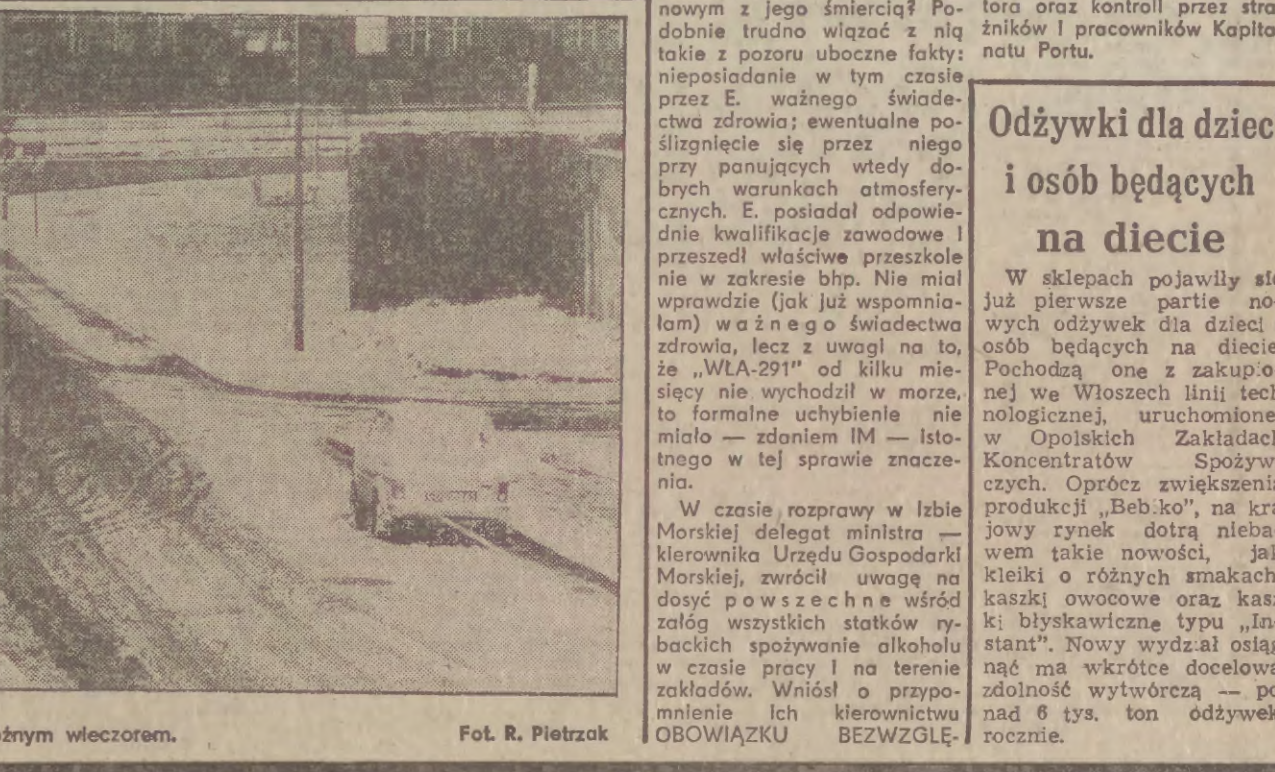
Gdańsk, ul. Stodowników późnym wieczorem.

W czasie rozprawy w Izbie Morskiej delegat ministra — kierownika Urzędu Gospodarki Morskiej, zwrócił uwagę na dosyć powszechne wśród załóg wszystkich statków rybackich spożywanie alkoholu w czasie pracy i na terenie zakładów. Wniósł o przypomnienie ich kierownictwu OBYWIAZKU BEZWZGLĘ-