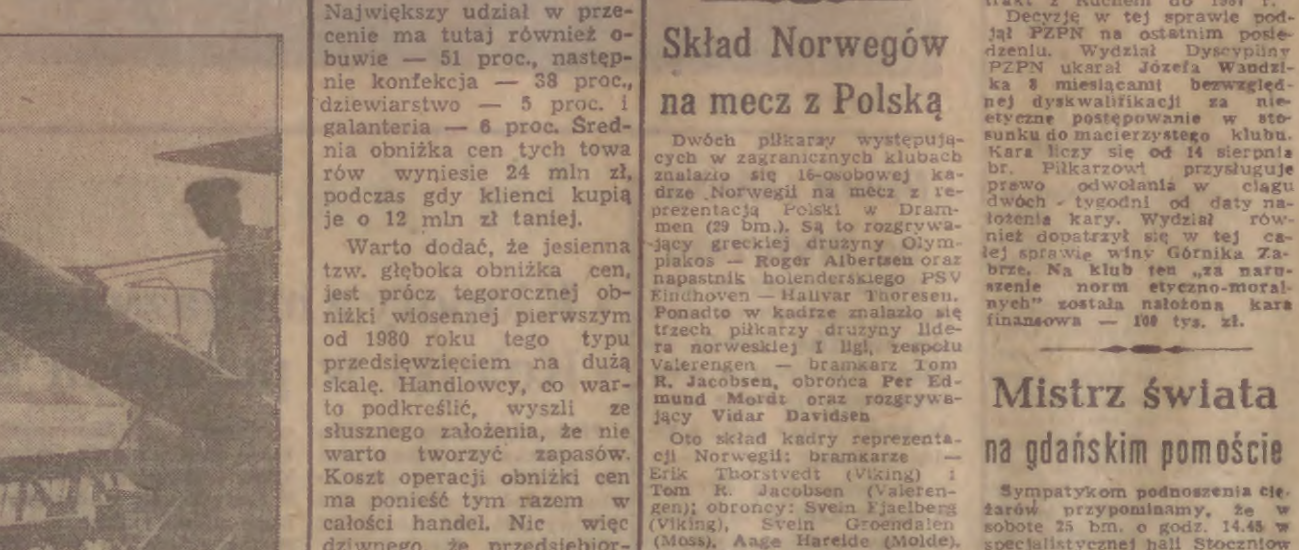
Szybko ubywa zboża na polach.

● Dokończenie ze str. 1 września br. — tylko w wytypowanych placówkach. Informacje o cenach i warunkach w sieci detalizacyjnej WZGS, przedstawił dyrektor Zakładu Obrótu Artykułami Przemysłowymi i Spożywczymi WZGS w Gdańsku — Józef Tadała. Sprzedaż artykułów po obniżonych cenach prowadzona będzie w 112 sklepach wiejskich i miejskich GS. Największy udział w przecenie ma tutaj również obojczy — 51 proc., następnie konfekcja — 38 proc., dziewiarstwo — 5 proc. i galanteria — 6 proc. Średnia obniżka cen tych towarów wyniesie 24 mln zł, podczas gdy klienci kupią je o 12 mln zł taniej. Warto dodać, że jesienią jest głęboka obniżka cen, jest prócz tegorocznej obniżki wiosennej pierwszym od 1980 roku tego typu przedsięwzięciem na dużą skalę. Handlowcy, co warto podkreślić, wysłali do sąstusznego założenia, że nie warto tworzyć zapasów. Koszt operacji obniżki cen ma ponieść tym razem w całości handel. Nie więc dziwnego, że przedsiębiorstwa handlowe w przyszłości przy zakupach towarów z przemysłu, zapowiedziały wnikliwą analizę wielu ich cech — jakości, wzornictwa i ceny. Chciałoby się rzec: „tak trzymać panowie handlowcy!”