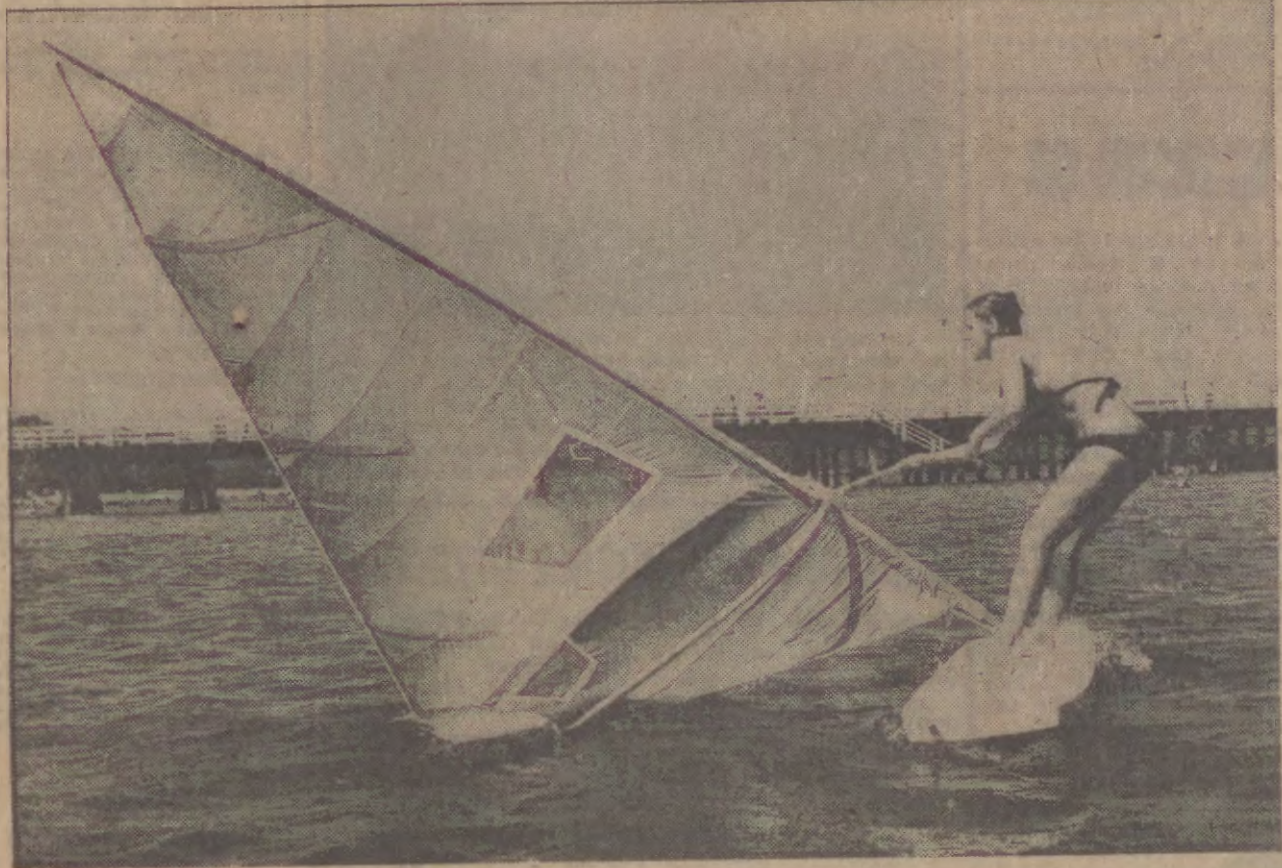
Znaganie z wiatrem.

Rok XL nr 201 (12136) Gdańsk, sobota 25, niedziela 26 sierpnia 1984 r. PL ISSN 0137-9062 Nr indeksu 35002 Cena 5 zł