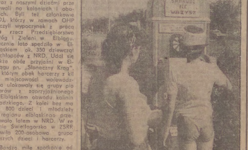
Być może, przybyło mi no wazę.

Dzieci i młodzież powracają już z kolonii, obozów i stań. Humory dopisują, jak to być wypoczynku udane. Z tym większą ochotą udadzą się niebawem uczniowie do szkół. W lipcu i sierpniu na ziemi elbląskiej z różnych form zorganizowanego wypoczynku i dobrej zabawy skorzystało łącznie ok. 34 tys. dzieci i młodzieży. Gościło tu też wiele grup dzieci i młodzieży z NRD, Związku Radzieckiego i Bułgarii. Najliczniejszą część stanowili młodzi obywatele z okręgu rodzkiego w NRD, którzy wraz z naszymi dziećmi przebywali na koloniach i obozach. Byli też członkowie FDJ, którzy w ramach OHP łączą wypracowane z pracą na rzecz Przedsiębiorstwa Drog i Zieleni w Elblągu. Łącznie lato spędziło w Elbląsku ok. 350 dzieci z rodzicami z NRD. Udział w tym także obóz przyznany w Elblągu pn. „Słoneczny Krag”, w którym obok harcerzy z kilku miejscowości województwa ulokowały się grupy pionierów z zaprzyjaźnionego z Elbląskiem obojczy kalinin rodzkiego. Z kolei bez mała 800 dzieci i młodzieży z regionu elbląskiego przebywało latem w NRD. W rejonie Świątoborska w ZSRB bawiła 200-osobowa grupa naszych dzieci i harcerzy.