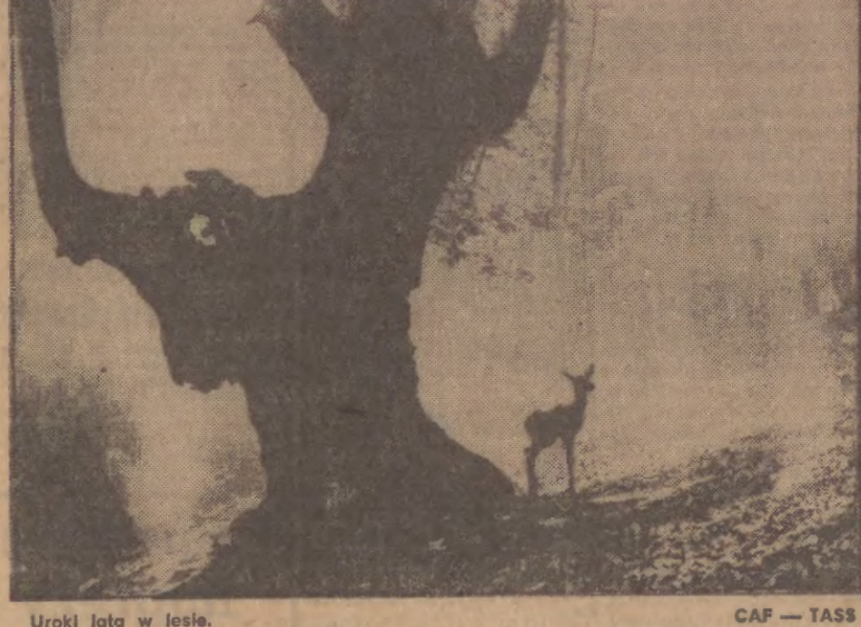
Urokliwa w lesie.