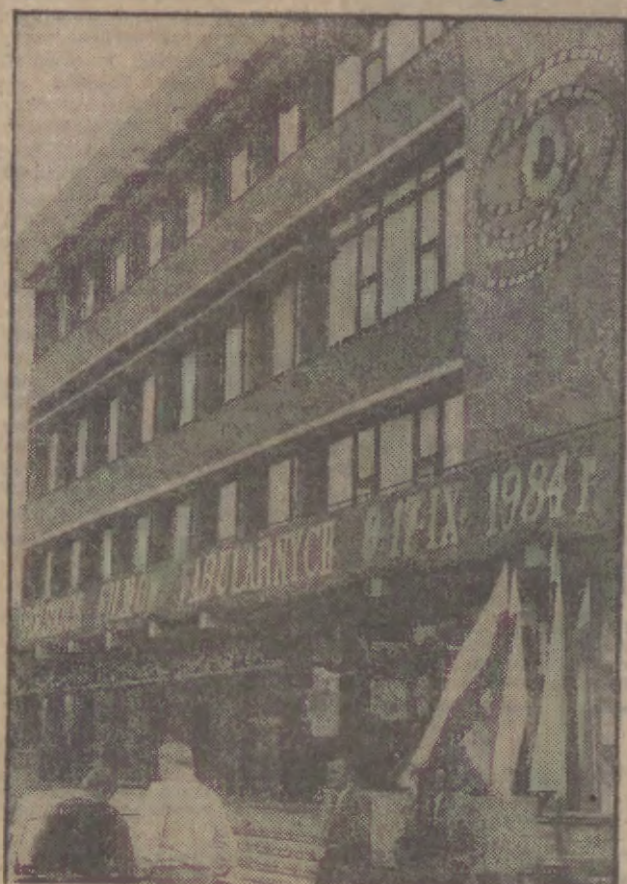
Festiwalowe centrum, jak dawniej, w Domu Technika w Gdańsku.

IX FFFF wzbudził ogromne zainteresowanie, czego dowodem jest także liczba festiwalowych gości. Do Gdańska przyjechało ponad 500 osób — 150 twórców i realizatorów filmowych, 100 dziennikarzy i obserwatorów, ponad 100 filmowców zagranicznych. Organizatorzy nie ukrywają, że sporo obiecują sobie na tegorocznych Targach Filmowych, w których ma wziąć udział 35 osób z 12 państw. Oferta z jaką wystąpią gospodarze obejmuje 48 polskich filmów fabularnych (już w wersjach obcojęzycznych) będących najbardziej interesującymi pozycjami w dorobku rodzimej kinematografii, od czasu — jak to określono — „Popiołu i diamentu”.