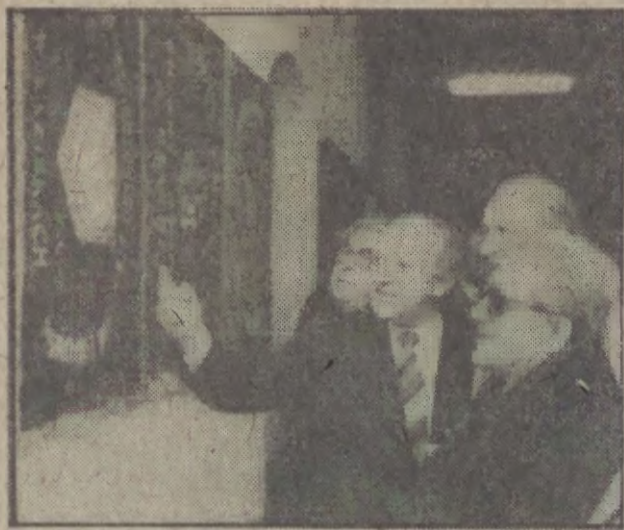
24. 11. 1984 r. w Lublinie odbyły się centralne uroczystości 35 rocznicy powstania ZSL. Na Zamku Lubelskim otwarto z tej okazji wystawę historycznych sztandarów ZSL.