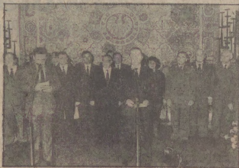
Sala Biała Ratusza Głównomiejskiego — Inauguracja XI Dni Leningradu w Gdańsku.

W niedzielę, w godzinach południowych, w odświętnie udekorowanej Sali Białej Ratusza Głównomiejskiego w Gdańsku, odbyła się uroczystość oficjalnego otwarcia zorganizowanych po raz jedenasty Dni Leningradu w Gdańsku.