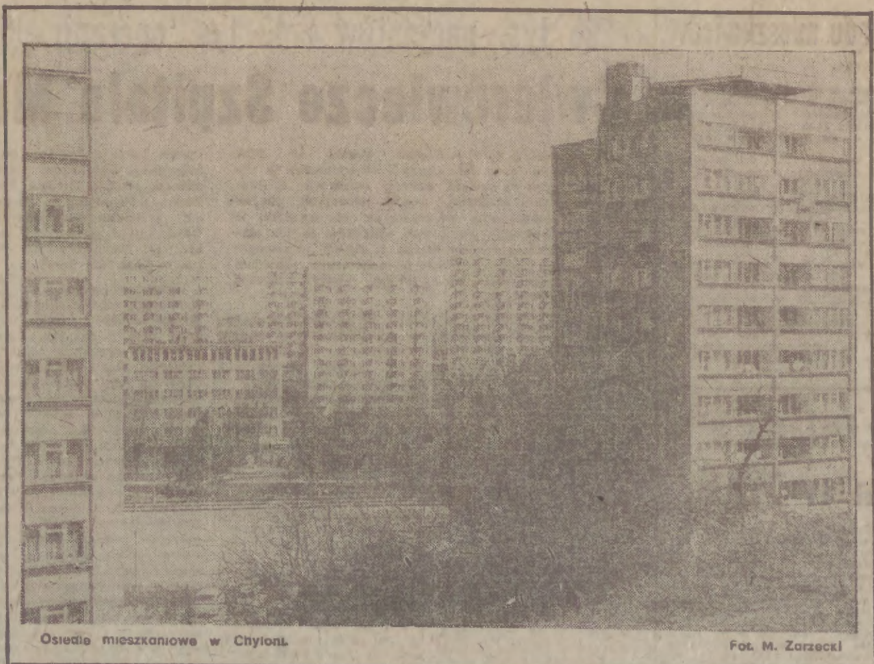
Osiedla mieszkaniowe w Chylonia.

PROBLEMY jakości produkcji przemysłowej, którym zajęto się na ostatnim posiedzeniu plenarnym KD PZPR Gdansk-Wrzeszcz, wywołują ożywioną dyskusję wśród przedstawicieli przedsiębiorstw. Głównymi