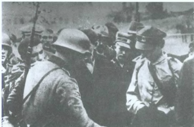
4. Rewizja wziętych do niewoli harcerzy