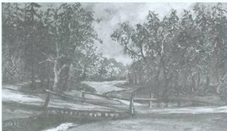
17. Śleża ( Zagórska Struga) niedaleko Piekietka