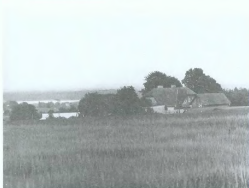
12. Krajobraz Kaszubski