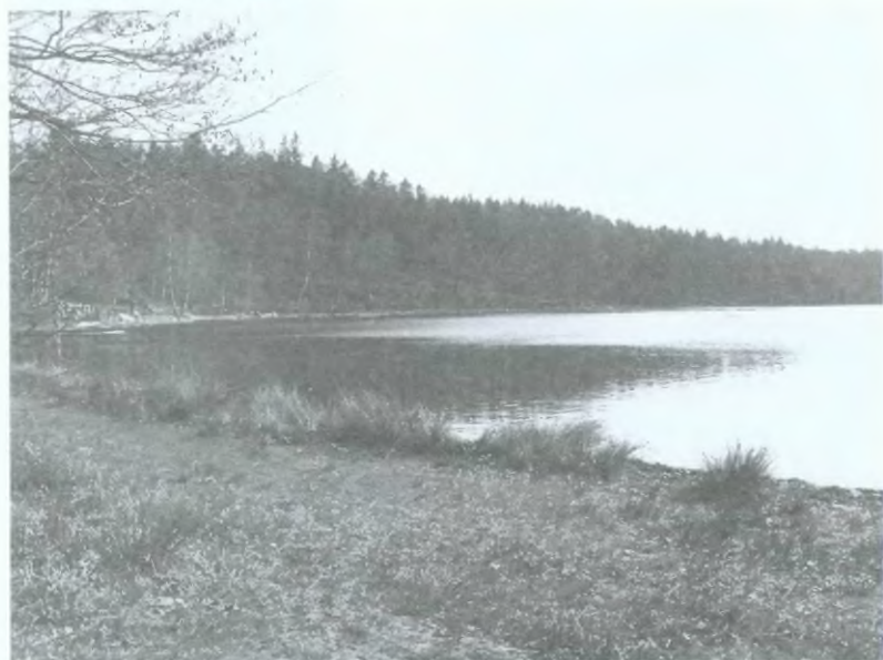
7. Jezioro Borowo w lesie za Nowym Dworem