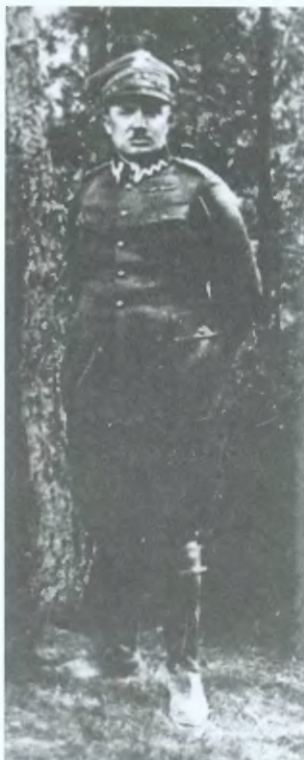
9. Pułkownik Stanisław Dąbek, Dowódca Lądowej Obrony Wybrzeża