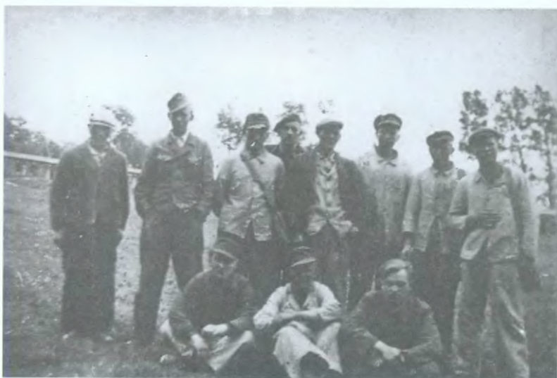
16. Pracownicy, więźniowie Organisation Todt z Kaszub