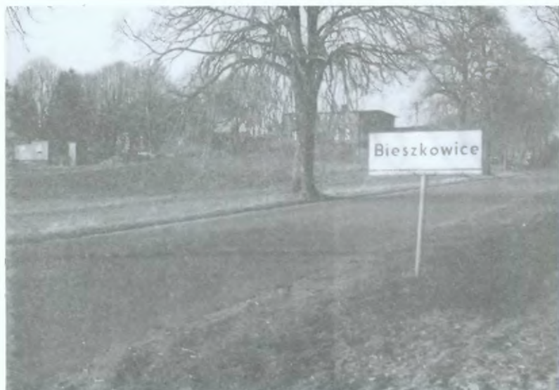
11. Fragment Bieszkowic (w głębi szkoła)