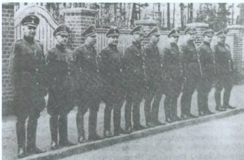
5. Wejherowscy gestapowcy