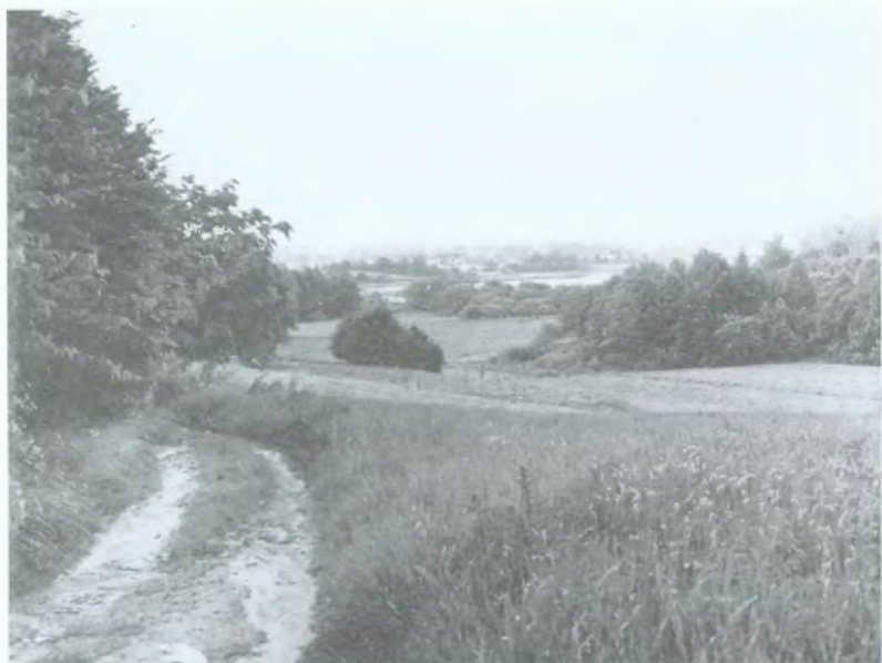
6. Krajobraz kaszubski