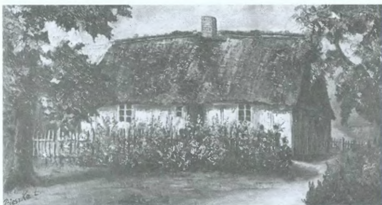
3. Rodzinna chata Radka Okroja