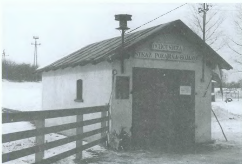
22. Remiza strażacka w Bojanie - kostnica partyzantów