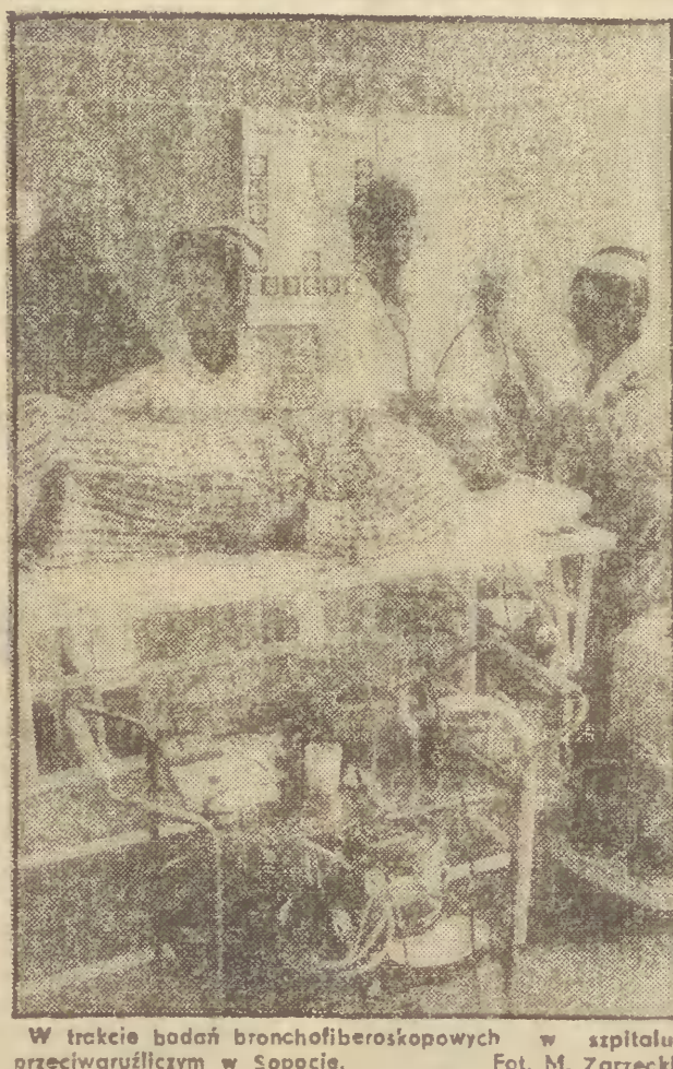
W trakcie badań bronchfiberoskopowych w szpitalu przeciwgruźliczym w Sopocie.