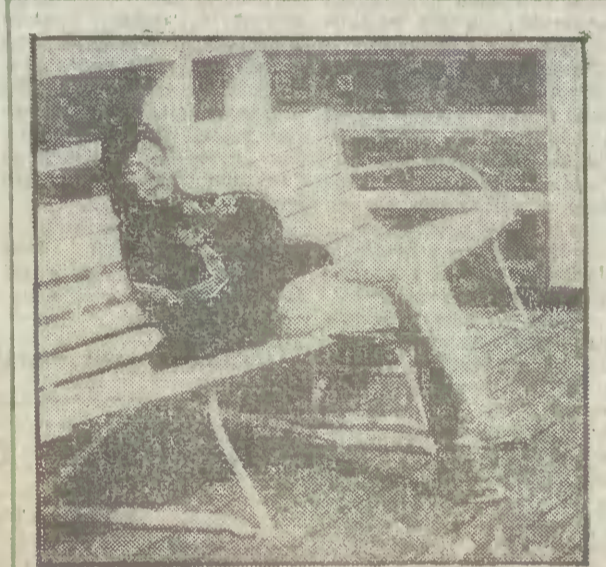
Jesienna drzemka... na soppokim moeku.