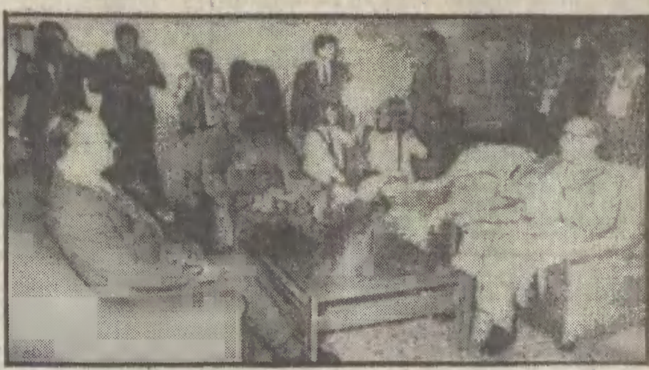
Podczas rozmów obu przywódców.

PL ISSN 0137-9062 Nr indeksu 35002 Cena 15 zł