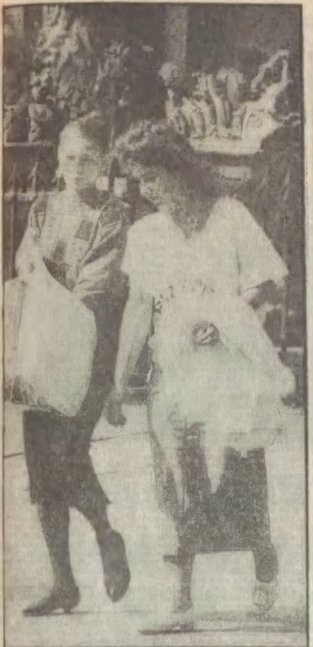
Chwilami jest jeszcze b. ciepło, ale zeby w krótkich rękawach — gorące dziewczyny...

Rok XLIV nr 231 (13362) 1 Gdańsk, wtorek, 4 października 1988 r. PL ISSN 0137-9062 Nr indeksu 35002 Cena 15 zł