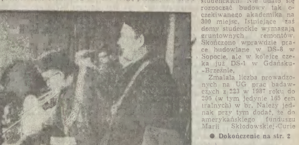
Jeszcze gratulacje od dziekana i wymarzony indeks w rękę...