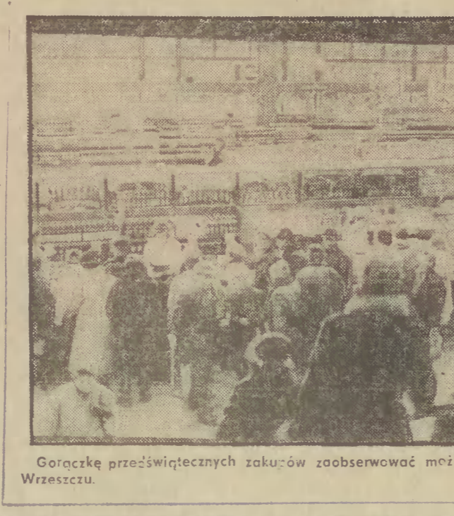
Gorące przedświątecznych zakupów zaobserwować można również w supermarcie we Wzrzeszczu.