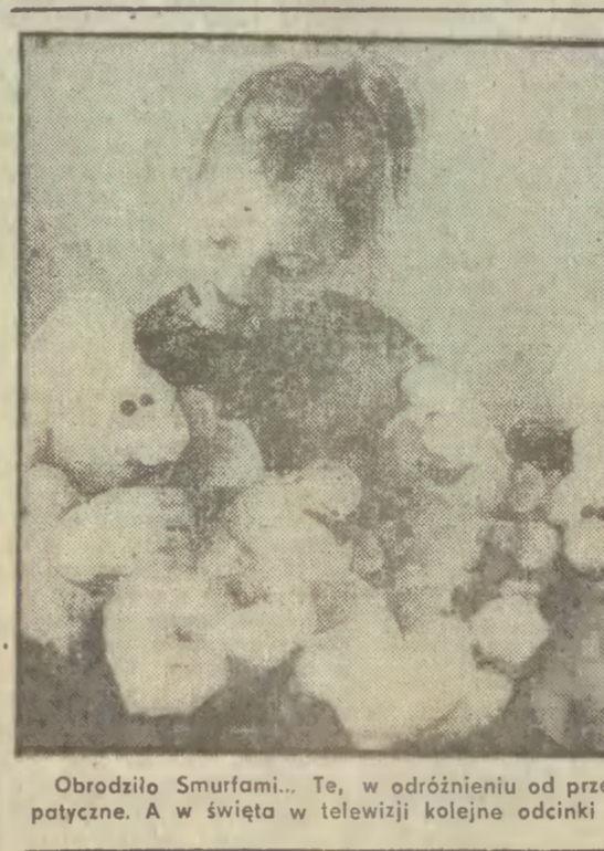
Obrodziło Smurfami... Te, w odróżnieniu od przetrząsanych koszmarek są całkiem sympatyczne. A w święta w telewizji kolejne odcinki przygód niebieskich ludków!

Należący do amerykańskich linii Pan American Boeing 747 z 258 osobami na pokładzie rozbił się w godzinę po starcie z lotniska Heathrow, skąd leciał do Nowego Jorku. Jumbo jet