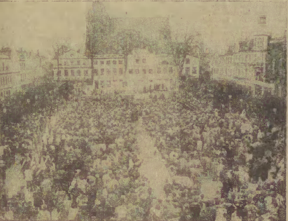
Msza św. na puckim rynku.

ku Chórów i Orkiestry wykonały min. „Hymn do Bałtyku”. Prezydent Wojciech Jaruzelski w swoim przemówieniu powiedział m.in.: „Buduemy Polskę wielkiej przyszłości, Polskę lepszego jutra. Ldźmy do europejskiego świata również morską drogą. Niech Wybrzeże będzie zaw-