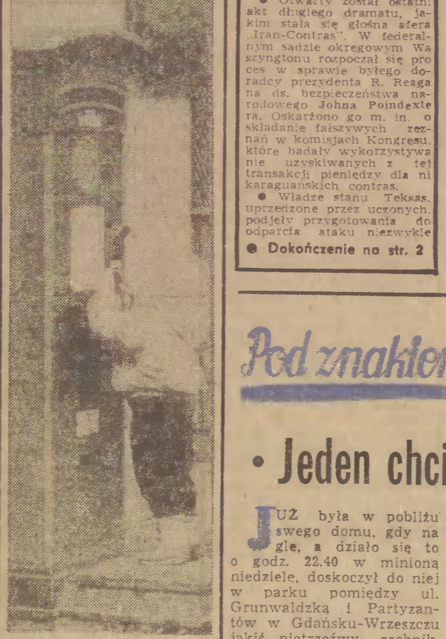
Może mnie kryzys jeszcze nie dotknął?

USA Stany Zjednoczone i RFN zakończyły opracowywanie szczegółowego planu ustalenia z terytorium zachodniomorskiego, kilkunastu amerykańskich pocisków artylerijskich w pełni uzbrojonych w systemy obrony. Po ciskach te mają być usunięte w okresie od sierpnia do grudnia br. Otwarty został ostatni akt długiego dramatu, jakim stała się głośna afera „Iran-Contras”. W federalnym sądzie okręgowym w Waszyngtonie rozpoczął się proces w sprawie wzięcia do rąk prezydenta R. Reaga na ds. bezprawnego naruszenia Johna Poindextera. Oskarżono go m.in. o składanie fałszywych zeznań w komisjach Kongresu, które badały wykorzystywanie nie uzyskiwanych z tej transakcji pieniędzy dla ni karabskich kontrast. Władze stanu Teksas, uprzedzone przez uczonych, podjęły przygotowania do odbicia ataku terrorystów.