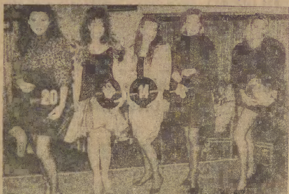
Gdańskie finałistki konkursu.