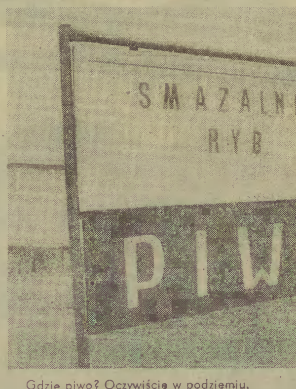
Gdzie piwo? Oczywiście w podziemiu.

Proszę Pana! Jak Pan po- żyje drugie 21 lat, to będzie Pan smiał nastolatki, żeby mieć prawdziwą przyjemność.