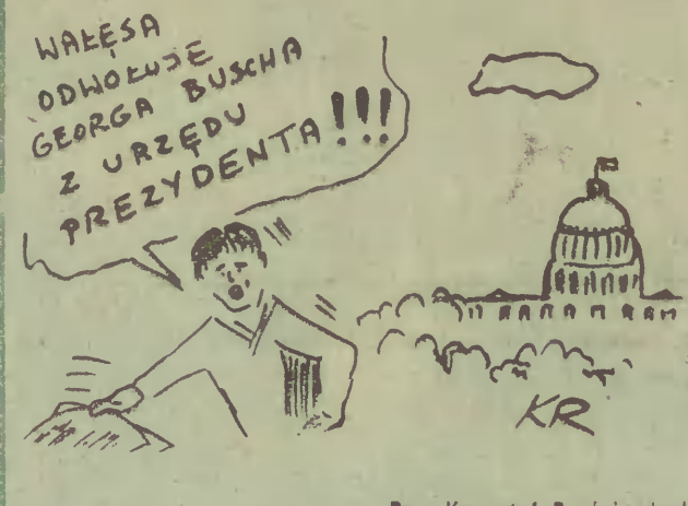
Rys. Krzysztof Rzeźniowiecki

Jan Waitala, chłopak okre- tony, będący w stałej rezer- wie PMH, jako Czyn Łipowy pomalował całkiem bezinte- resownie i w godzinach poza