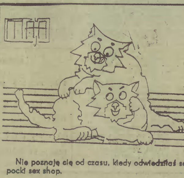
Nie poznaje cię od czasu, kiedy odwiedziłaś se- pocki sex shop.

Odpowiedź udzielona kli- entowi z Niemiec — Wait- a moment bitte, jeno paragon zabukuje.