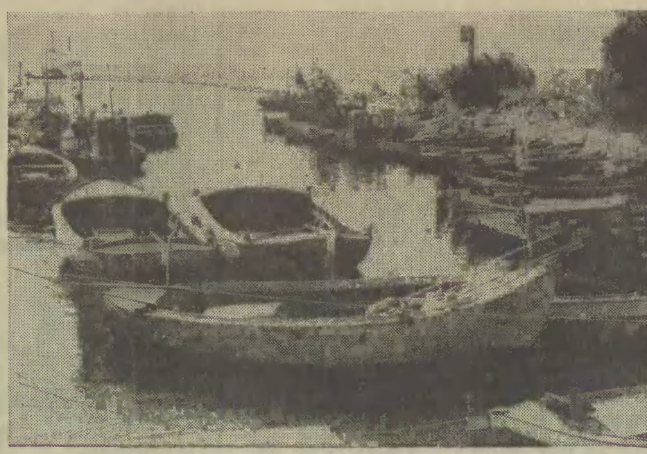
Przystań w Jastarni. Rybackie łodzie już niedługo wyruszą w morze. Czy uda się połow.