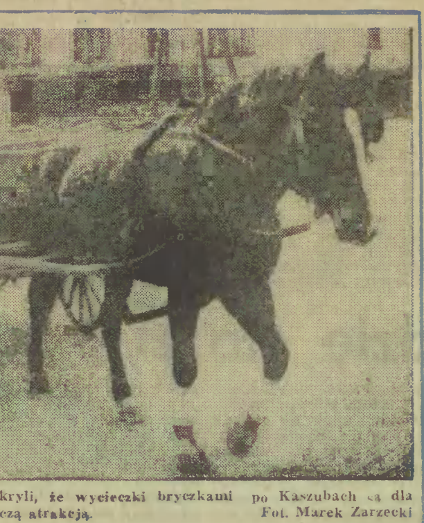
Mieszkańcy Chmielnia odkryli, że wycieczki bryczkami po Kaszubach są dla turystów wielką krajoznawczą atrakcją.