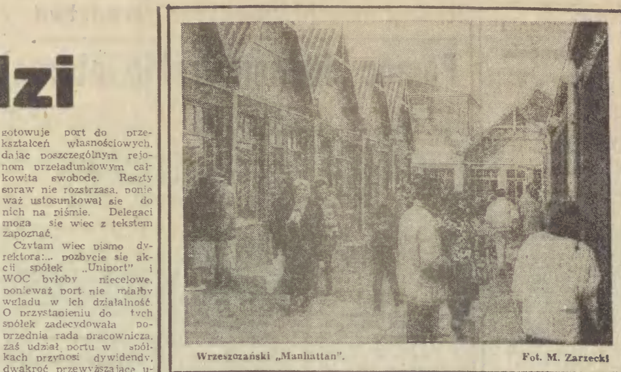
Wrzeszozański „Manhattan”.

Pyt.: Patrząc na to wstecz, czy ma pan poczucie winy związane z tym okresem, z ogłoszeniem stanu wojennego? Odp.: Tak, żałuję, że nie byłem w stanie zapobiec wszystkim rozdzajom przemocy, które miały miejsce — ograniczyjąc np. skale in- ternowania, błędnych, a nie- kiedy skandalicznych decy- zji o internowaniu ludzi, którzy nie powinni być in- ternowani. Nie zdolalem także ograniczyć władzy sił konserwatywnych w partii. Kiedy niebezpieczeństwo było już zagrożone, użył oni porównania stanu wojen- nego, aby załokować re- formy, które miałem już na uwadze wprowadzając ten stan. Nie był to mój pro-