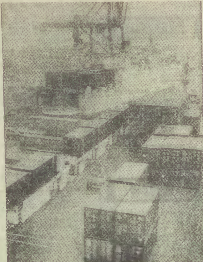
Terminal kontenerowy MPH w Gdyni.

gotuje port do prze- kształcen własnościowych, dając poszczególnym rejon- om przedmiotowy ćwik- kowiata swobodę. Reszty spraw nie rozstrza, ponie- aż ustosunkował się do nich na piśmie. Delegaci mogą się więc z tekstem zapoznać. Czytaw więc pismo dy- rektora... pozbycie się ak- cji spółki „Uniport” i WOC byłoby niecelowe, ponieważ port nie miałby wzrostu w ich działalności. O przystąpieniu do tych spółek zadecydowała po- przednia rada pracownicza, zaś udział portu w spół- kach przynosi dywidendy, dwukrotnie przewyższające ulokowany w nich kapitał... prowidziano pobrana przez dyrektora była zaliczkowa, na co uzyskano zgodę mi- nisterstwa. Jednak wobec kontrowersyj, gdy wróci- łem ze zwolnienia choro- bowego, polecielem te pienia- dzę zwrócić do kasy por- tu, gdzie o zaniechaniu działalności radiowej pod- jąłem zgodzie z przysłu- żaczami mi uwarunkiami statutowymi. (Zapoznalem się z prze- pisami na które powoły- wał się dyrektor Stencel. Rzeczywiście mógł zam- knąć radiowęzeł. Odnośnie jednak wrażeń, że wia- zało się to bezpodstawnie „wona”, toczona z Solidar- nością” która dyskredito- wała działalność szefa por- tu...)