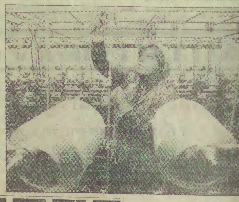
Nowosolska Fabryka Nici „ODRA”, produkująca nici bawełniane, llniane i syntetyczne...