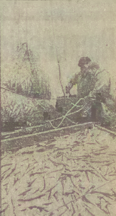
Przedsiębiorstwo Polowów i Usług Rybackich „Barka” w Kolobrzegu (przebiegający w rybolowie baltickim) dysponuje 48 kutrami. „Barka” wykonała już plan polowów tego roku w 45 procentach.

W ostatnim dniu sympozjum poruszano problemy praktyki gospodarczej — z dziedziny hutnictwa, chemii i transportu — jak też współdziałania nauki z praktyką na przykładzie innowacji powstających w naukach rolniczych. (Dokończenie na str. 2)