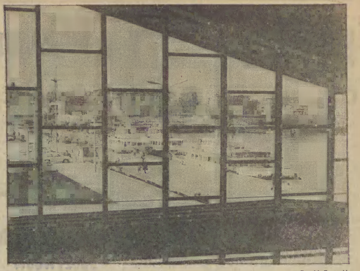
Przystań żeglugi białej floty w Gdyni.

Na stoiskach polskich wydawców czołowe miejsce zajęły wydawnictwa młodzieżowe i wszechstronnym dorobkiem naszego kraju w minionym 35-leciu.