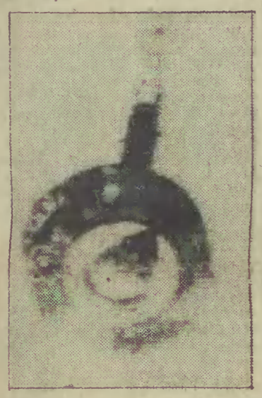
15 maja br. nastąpiło połączenie automatycznego statku transportowego PROGRESS-6 z zespołem orbitalnym SALUT-6 — SOJUZ-32. Na zdjęciu: PROGRESS-6 zbliża się do zespołu