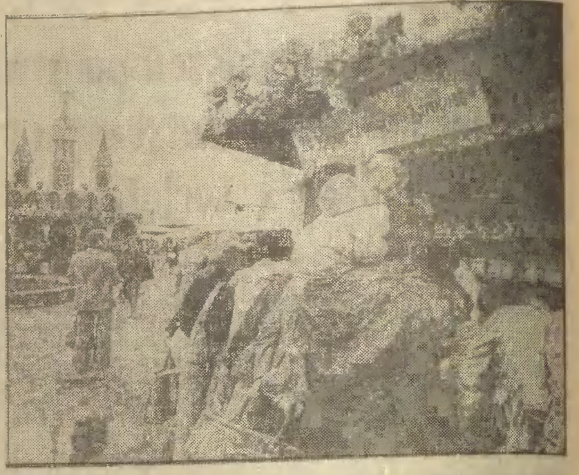
W Gdyni otwarto po raz szósty jarmark ludowy.