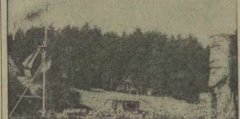
Na placu apelowym w harcerskim ośrodku „Morena”.