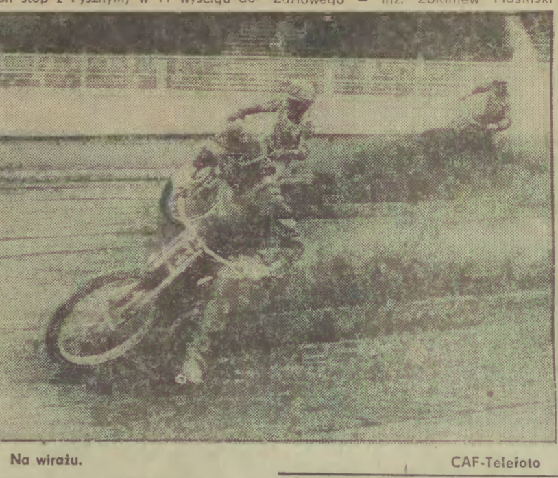
Na wirażu.

24-letni Francuz Hinault wygrał 66-kilometrowy etap Tour de France, powtarzając swój sukces sprzed roku, kiedy także zwyciężył w tej imprezie. Hinault uzyskał łączny czas - 100:05,5 i wyprzedził Holendra Joopa Zoetemelka o 3,97, Portugalczyka Joaquim Agostinho o 24,3, Hennie Kulpera (Holandia) o 28,02 i swego rodaka Jeana-Rene Bernaudeau o 32,5.