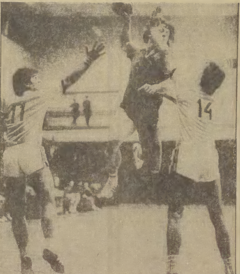
Już w najbliższy wtorek rozpoczyna się w Gdańsku i Elblągu wielki międzynarodowy turniej pikarzy różnych z udziałem dwóch naszych reprezentacji. Mam nadzieję, że emocji nie zabraknie a takich akcji jak ta na zdjęciu oglądać będziemy wiele.