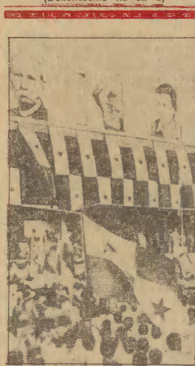
Około 200 000 Panamczyków wzięło udział w uroczystościach przejęcia przez Panamę strefy kanału w dniu 1 bm.