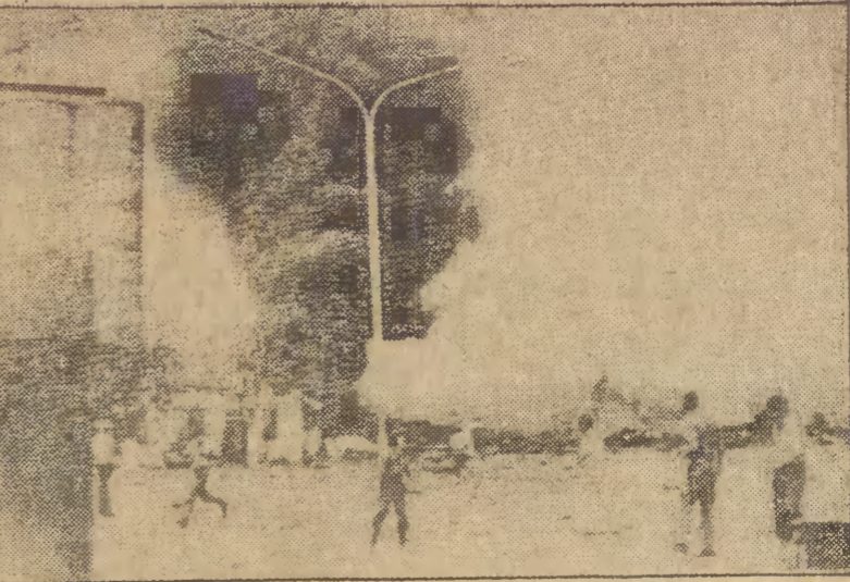
1 bm. w kretańskim porcie Khania nastąpił wybuch na statku wiozącym dynamit i butle z butanem. 1 osoba zginęła a 106 odniosła rany.

W stolicach europejskich notowano następujące temperatury: Amsterdam 18 st. C, Ateny 25, Belgrad 17, Berlin 11, Bruksela 16, Genewa 14, Helsinki 8, Kopenhaga 12, Lizbona 26, Londyn 20, Madryt 27, Moskwa 5, Oslo 9, Paryż 18, Rzym 25, Sztokholm 12, Wiedeń 15 st. C.