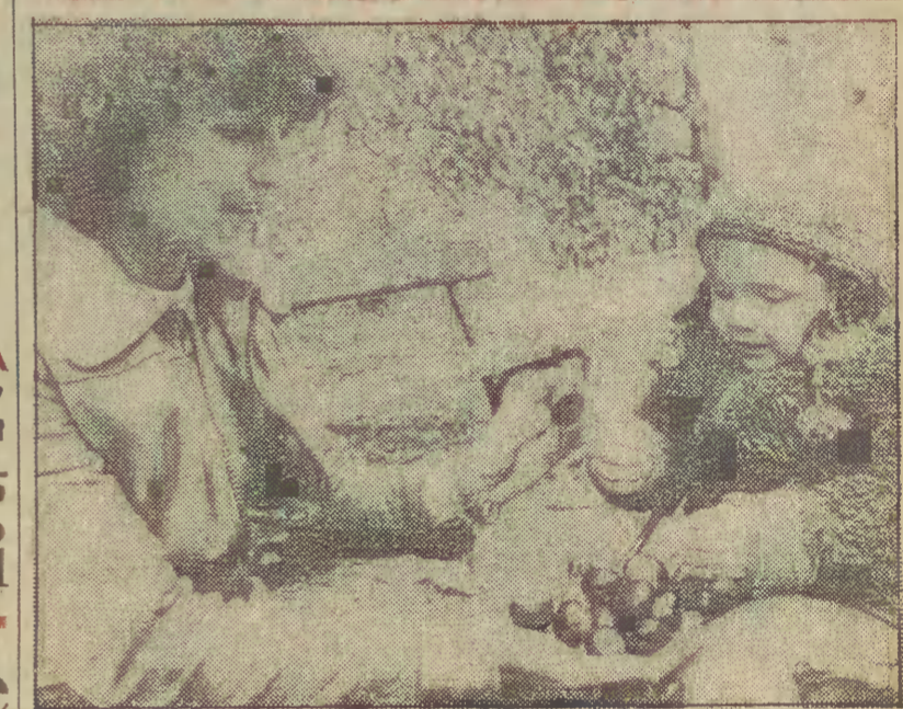
O jesieni najpiękniej opowiada mama.